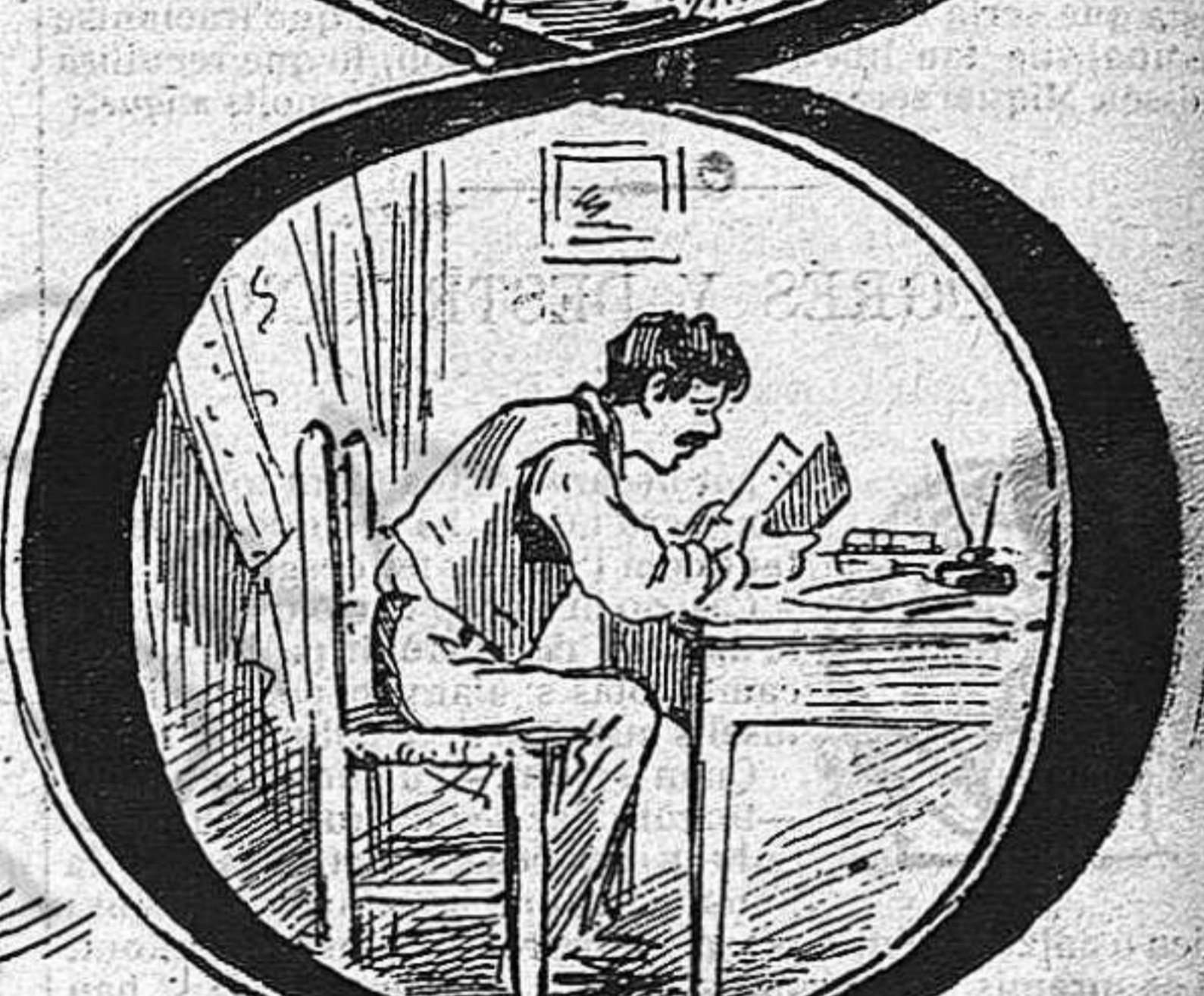
Vuyt horas per treballar.