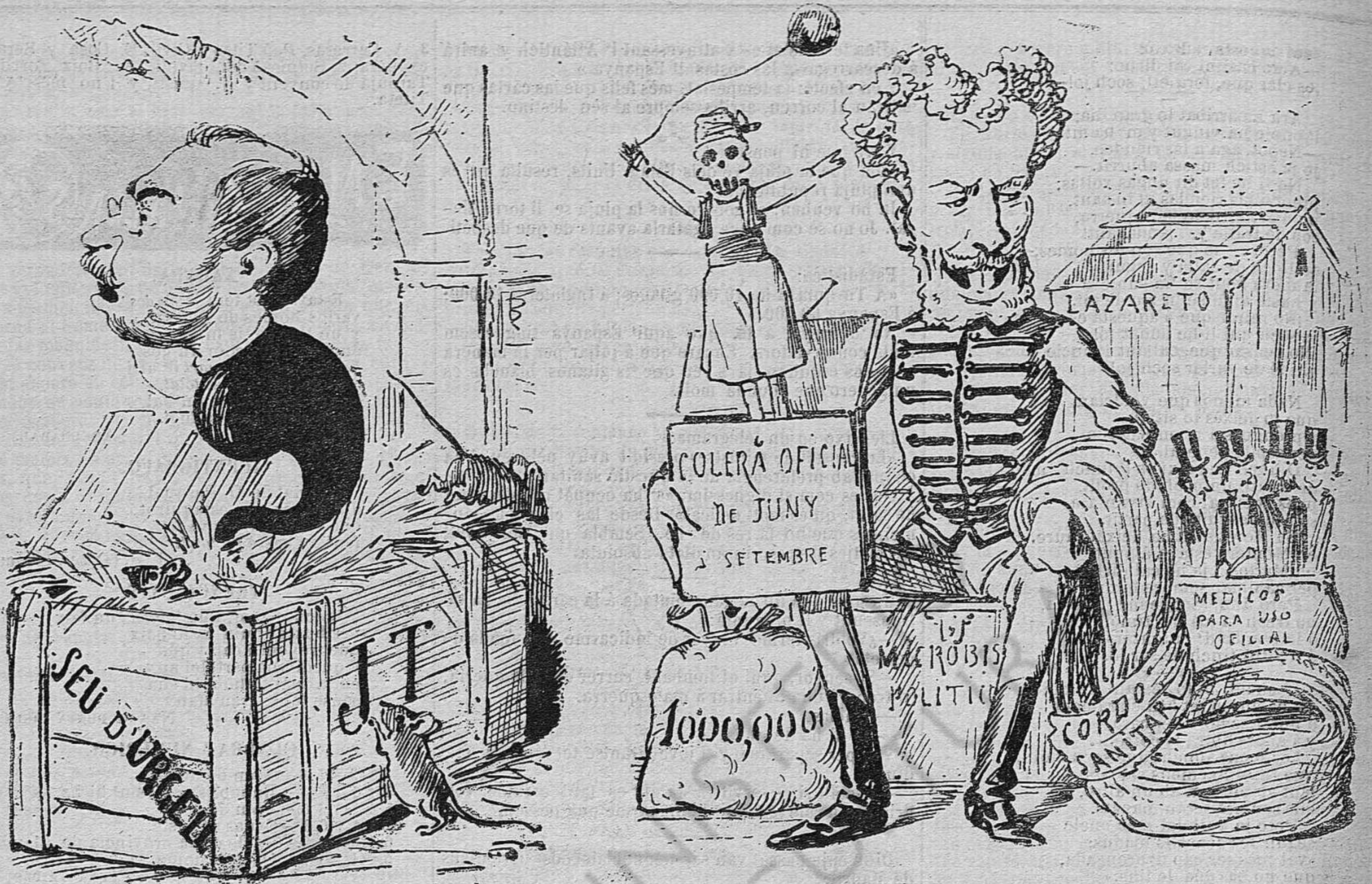
Miréulo... Es un dels micrbis más graves que se conocen.