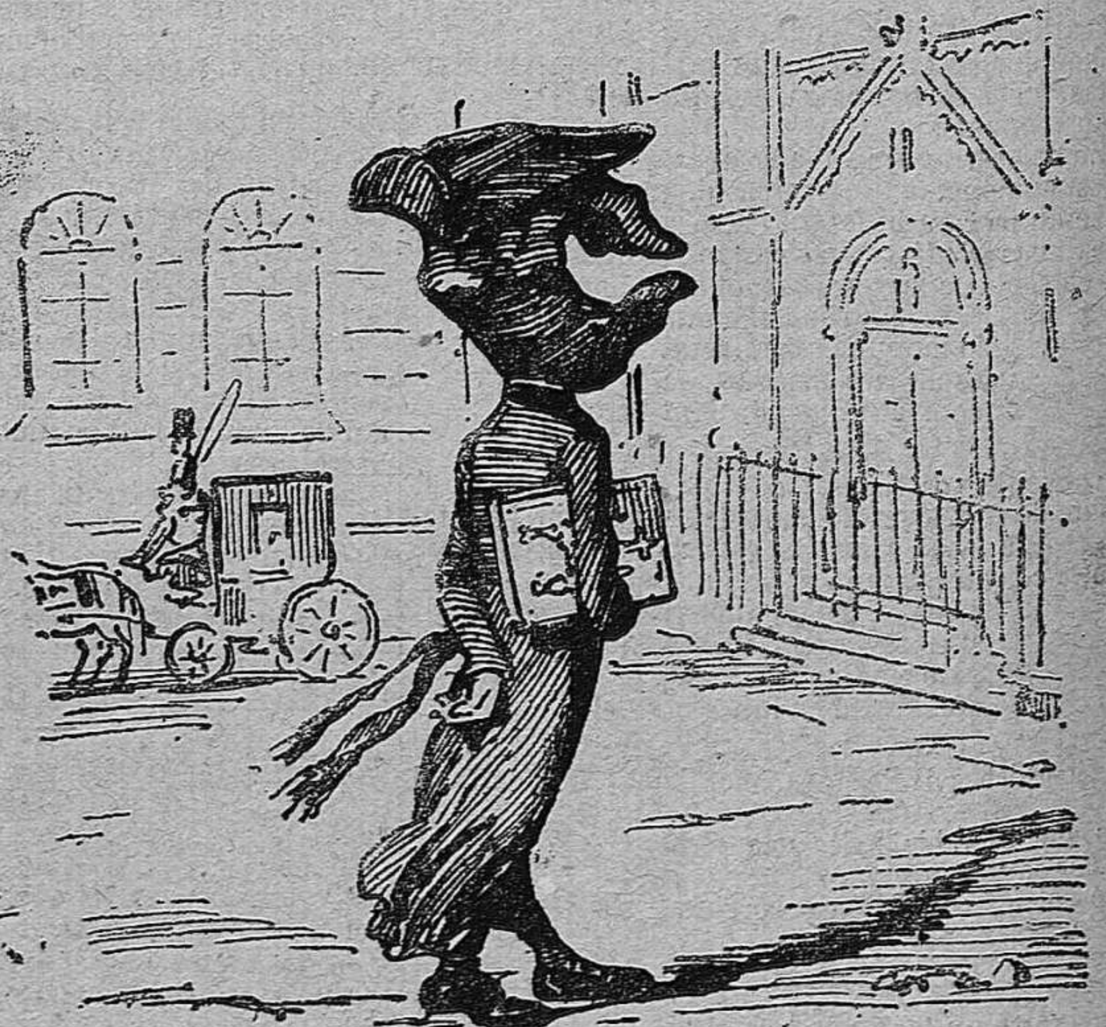
Un' altra classe de má negra, contra la qual protestan tots los amichs del progrès.