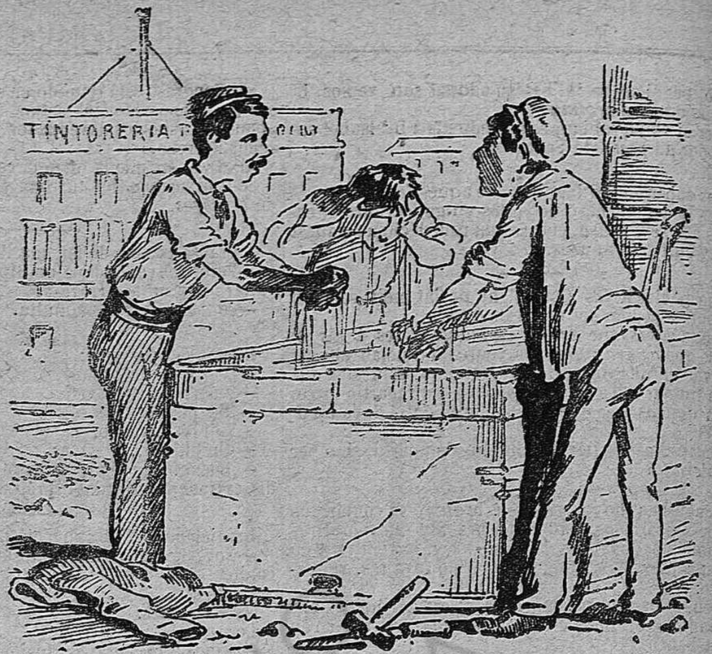
D' aixó que diuhen de Andalusia, nosaltres nos ne rentém las mans.