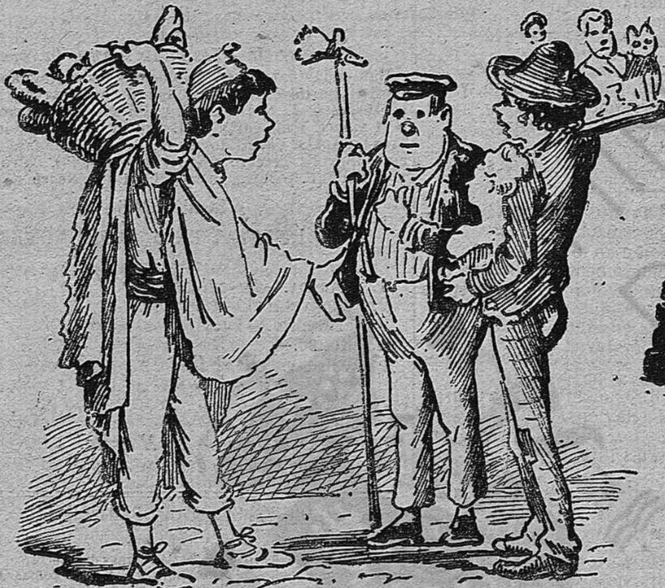
De nosaltres tres sí, que no crech que ningú 'u puga sospitar.