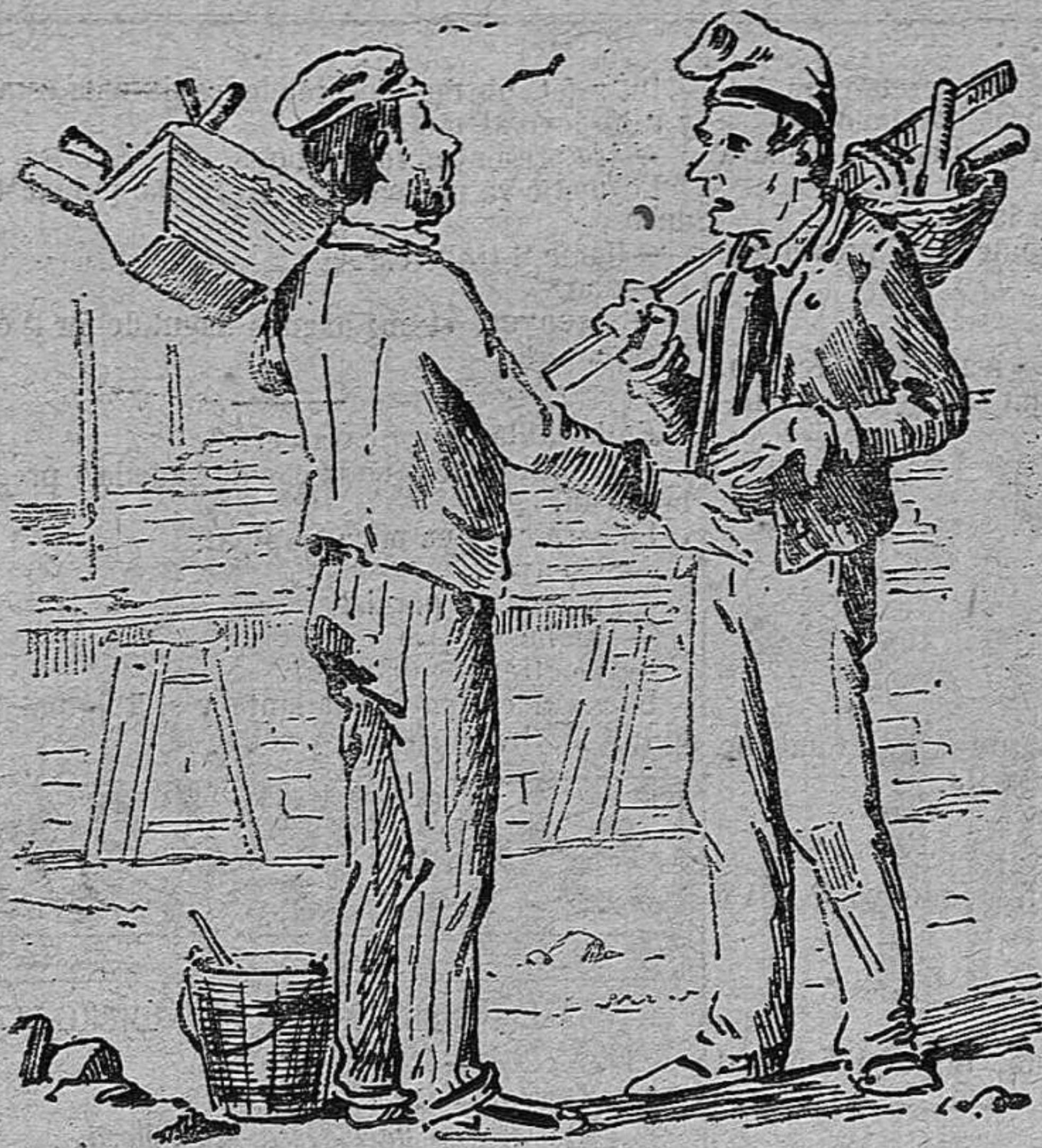
Nosaltres no hém de protestar: las nostras mans de blancas sempre 'u sou.