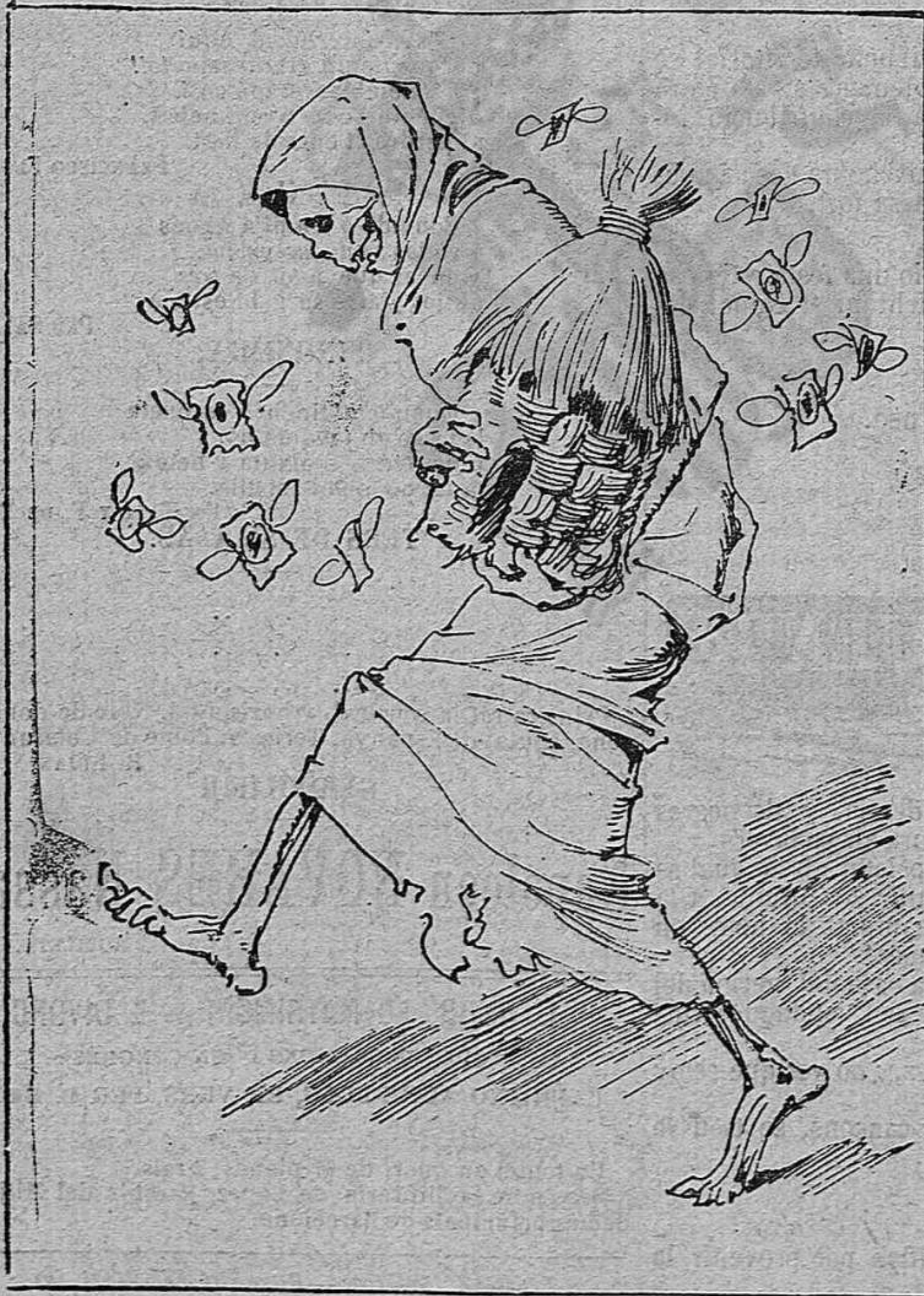
D' Industria nacional.