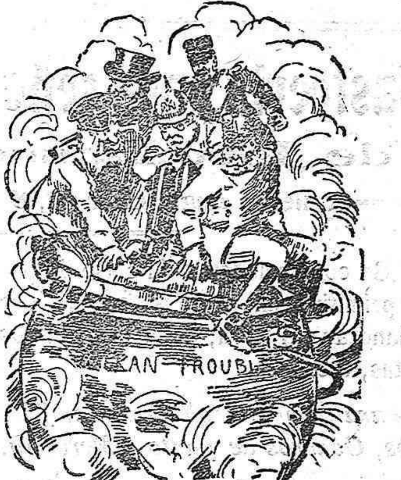
En punto de ebullición. (Del Punch, de Londres)