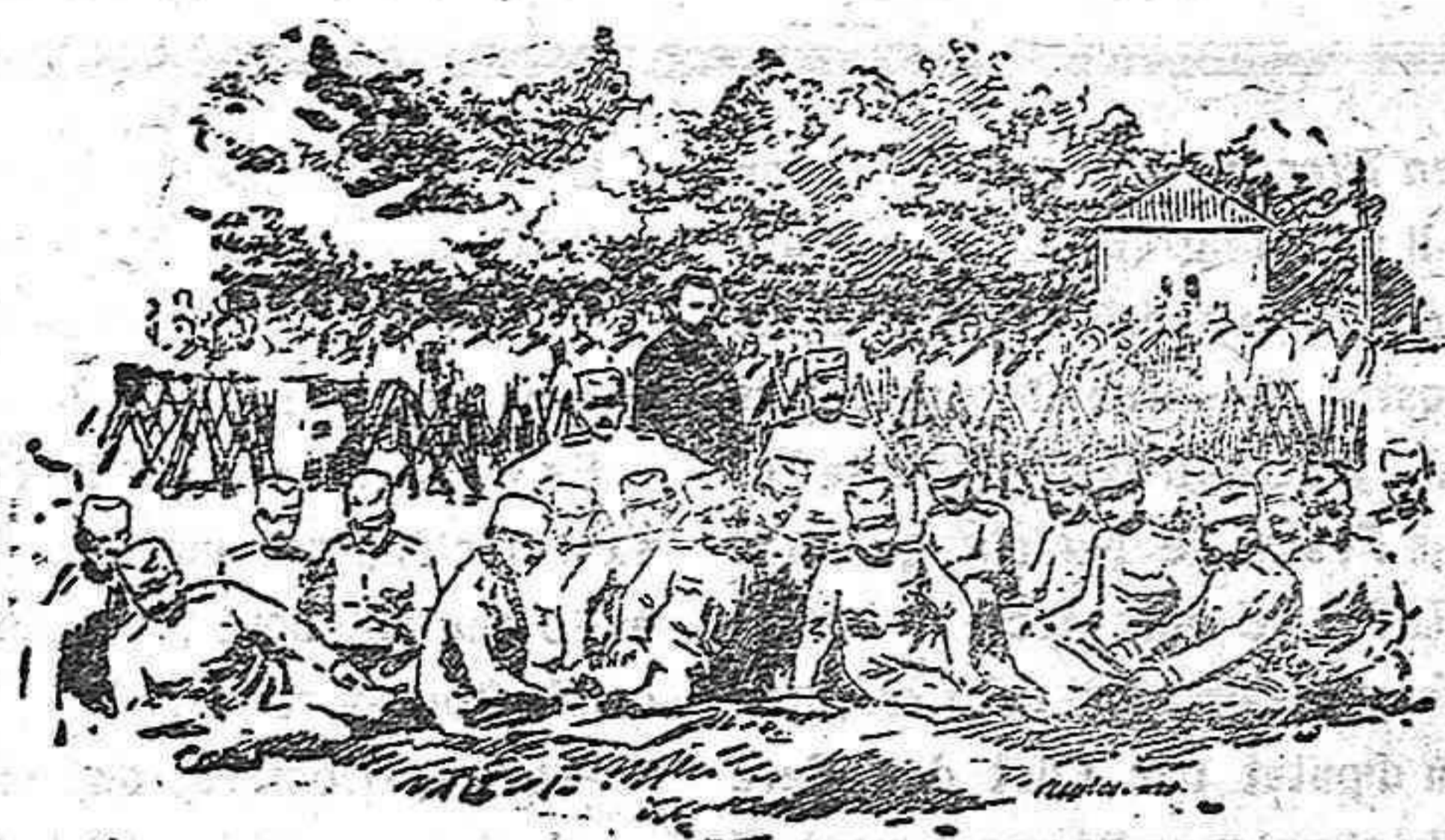
Campamento búlgaro en las cercanías de la línea de T. h. tidja

batiendo el tambor como llamado a la lucha a las huestes tradicionalistas.