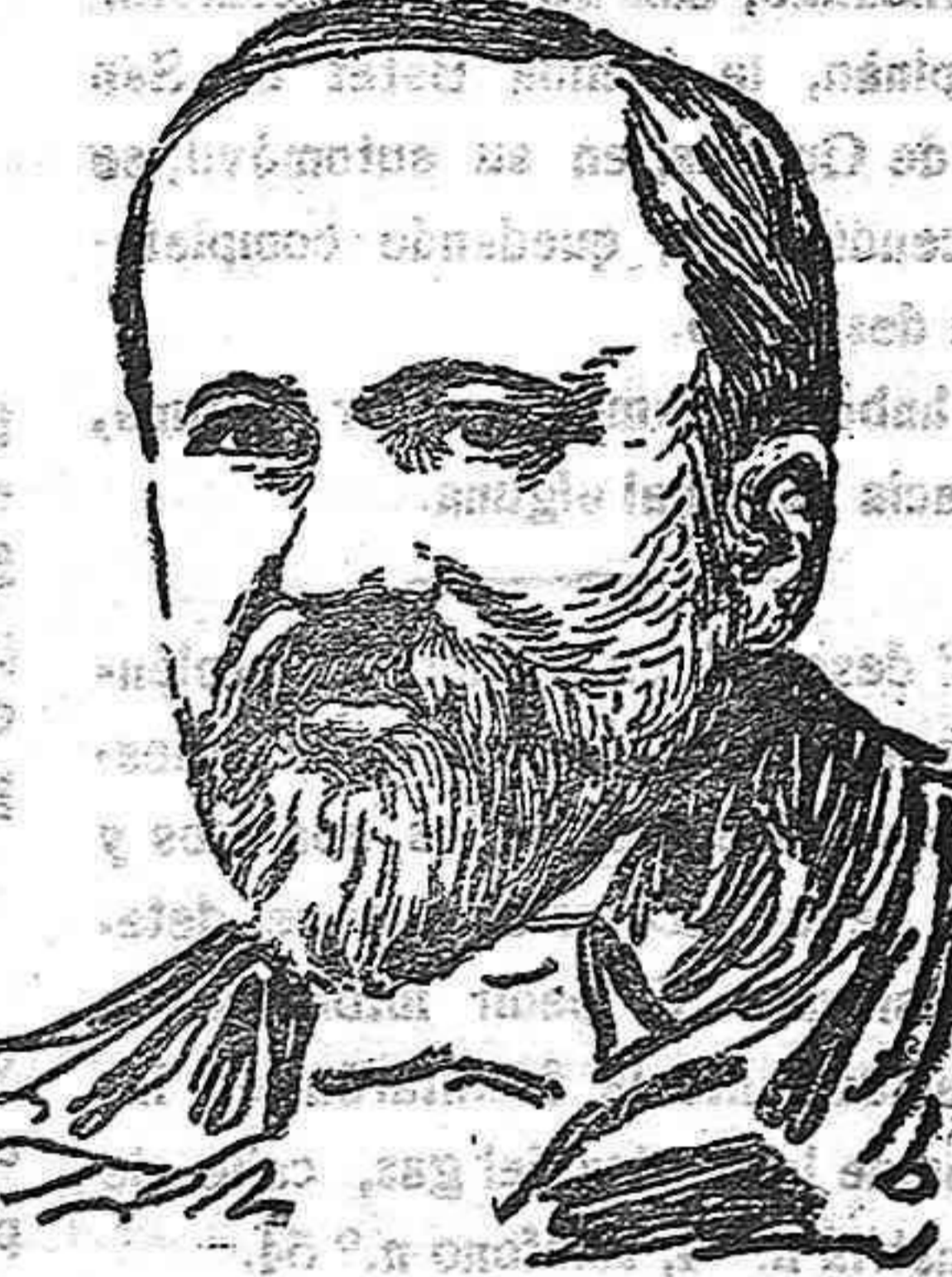
Mr. Poicarré ministro de Negocios Extranjeros de Francia.

En lo referente al Califato, Misiones religiosas, Aduanas, Deudas del Magzzen, Ferrocarril de Tánger a Fez, Policía de las fronteras e Internalización de Tánger, han predominado las proposiciones españolas, si bien tenemos que dolernos de algunos lunares. Es evidente que el Tratado representa para