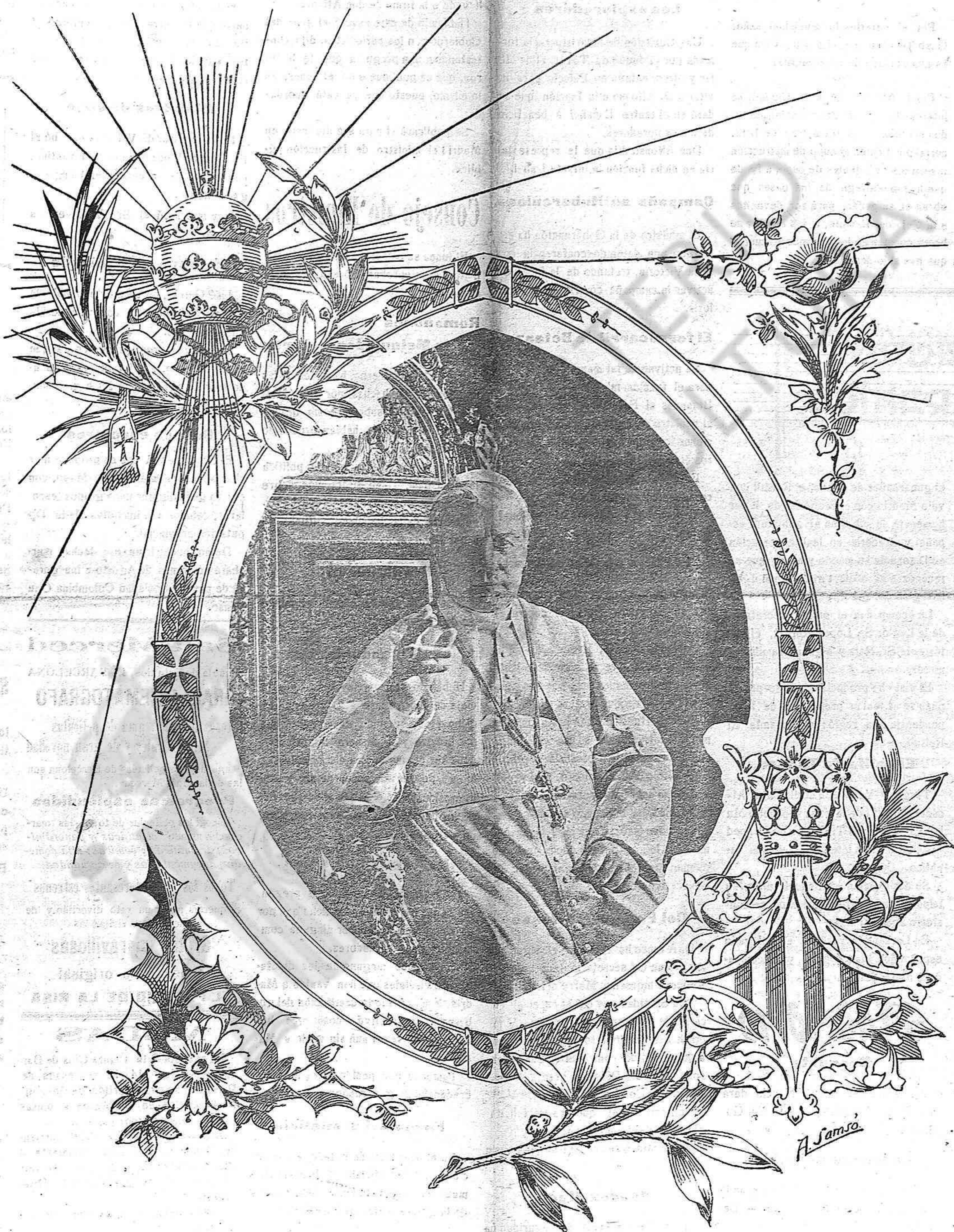
S. S. Pius X, restaurador de la música sagrada