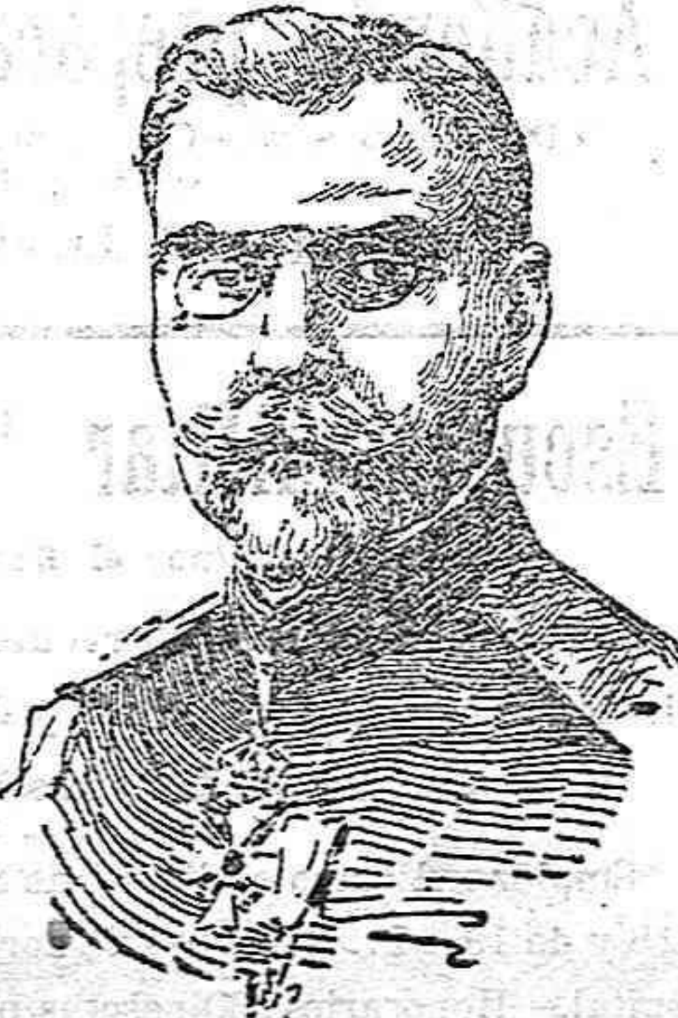
General bulgaro Jotoff comandante en jefe del ejército que opera en la región de Cavalla.