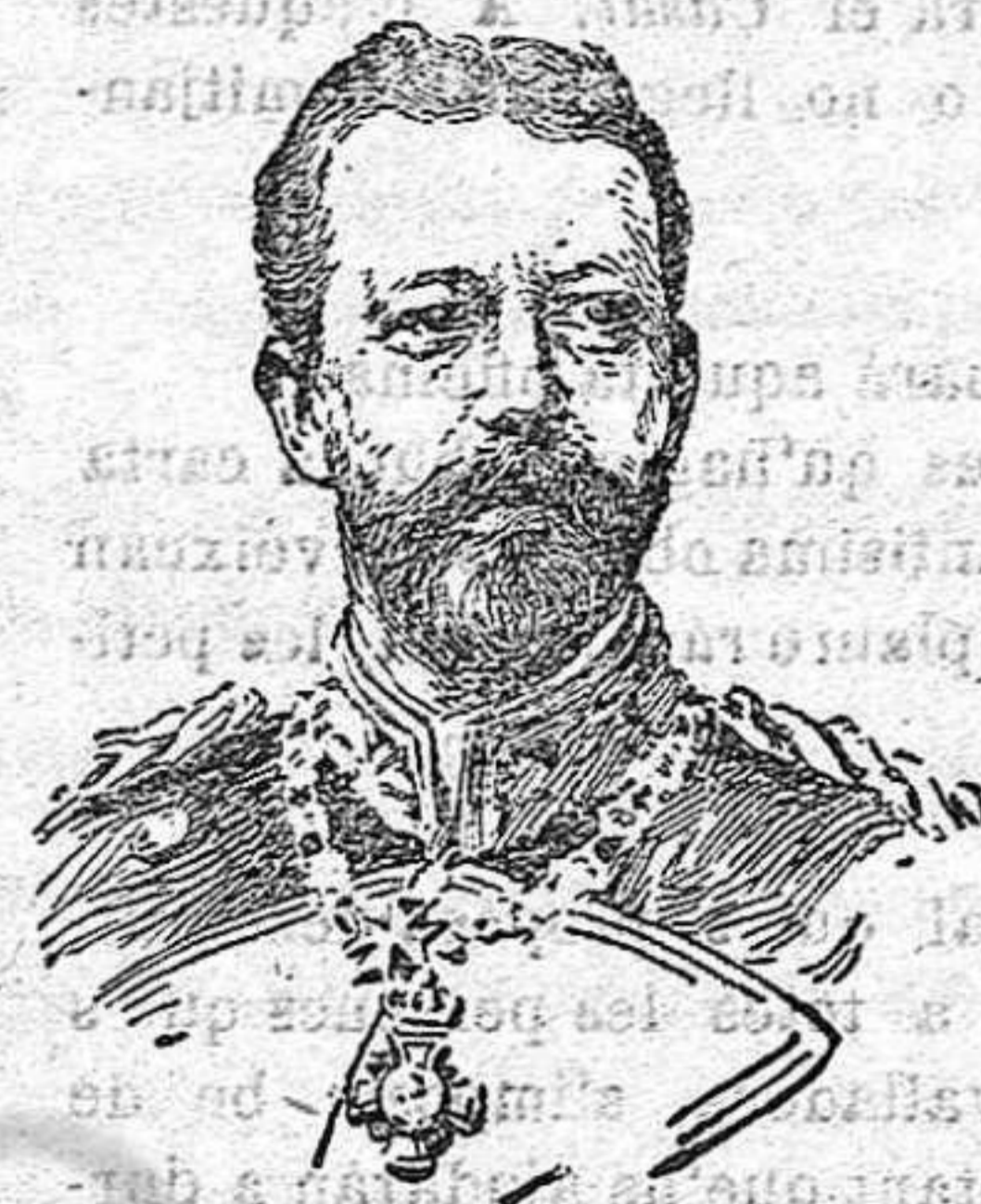
El príncipe Enrique de Prusia hermano del emperador Guillermo y generalísimo de las escuadras alemanas.