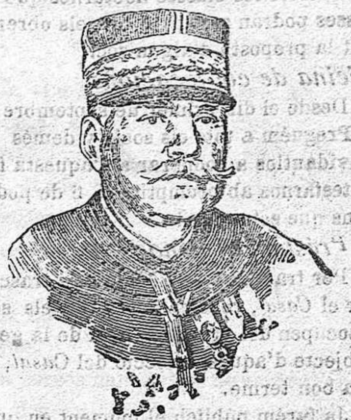
General Joffre generalísimo del ejército francés.

fácilmente hoy por los ferrocarriles. Pero las reservas? Las reservas no tienen el empuje de los soldados en activo, pero son imprescindibles en las guerras.