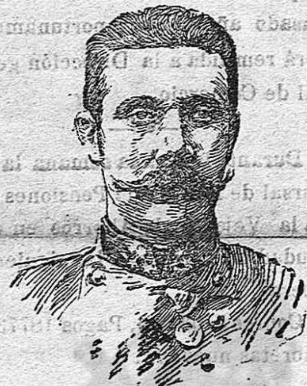
El príncipe heredero de Austria, archiduque FRANCISCO FERRER, asesinado en Sarajevo.