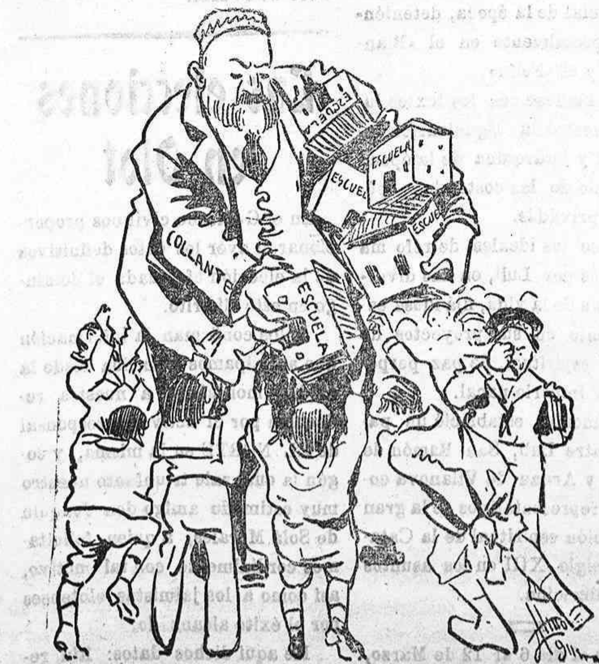
HUELGA DE ANALFABETOS