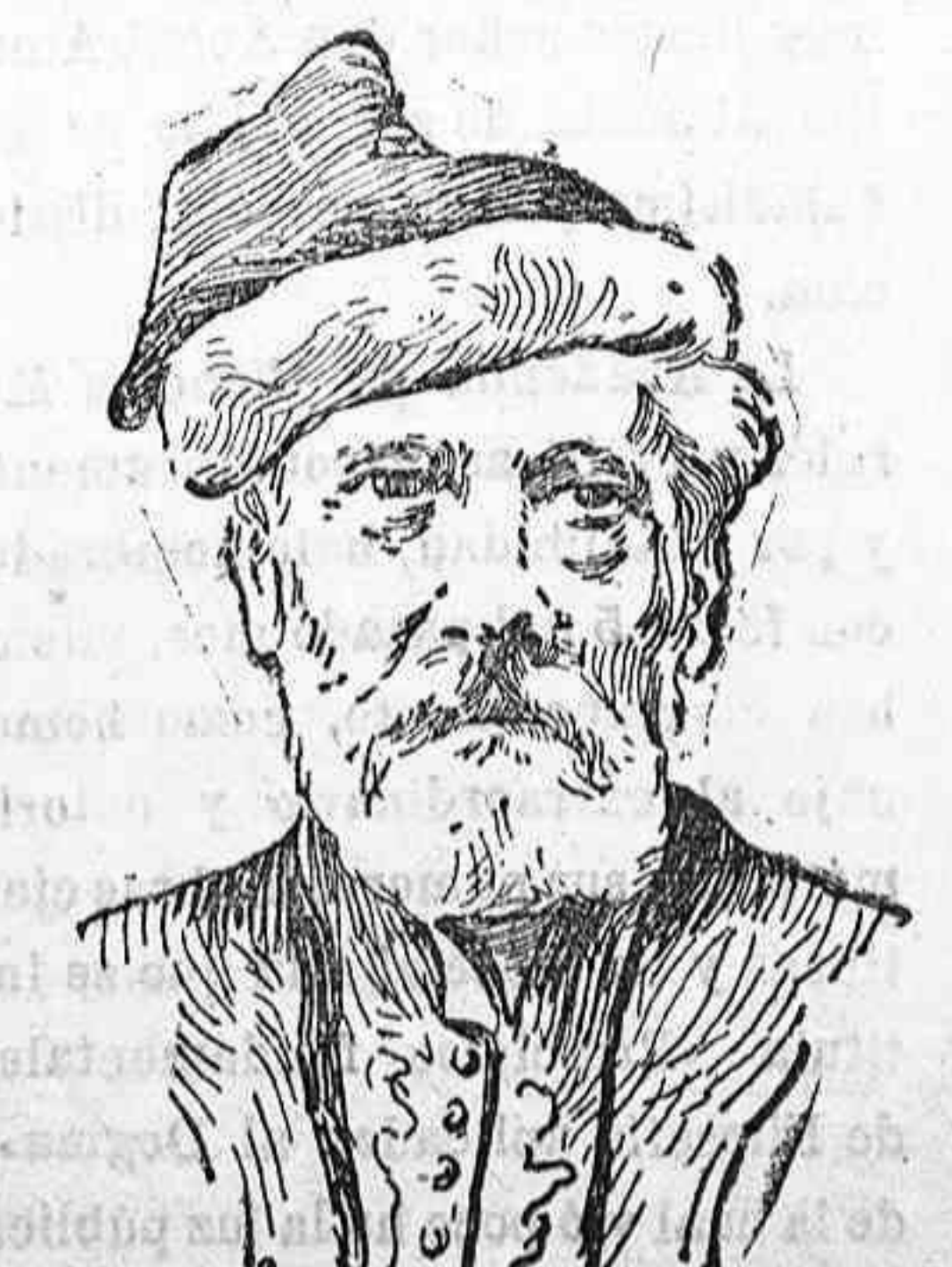
El conde Estanislao Stanke Jefe de un cuerpo de ejército de voluntarios polacos, que pelea en las filas austro alemanas.