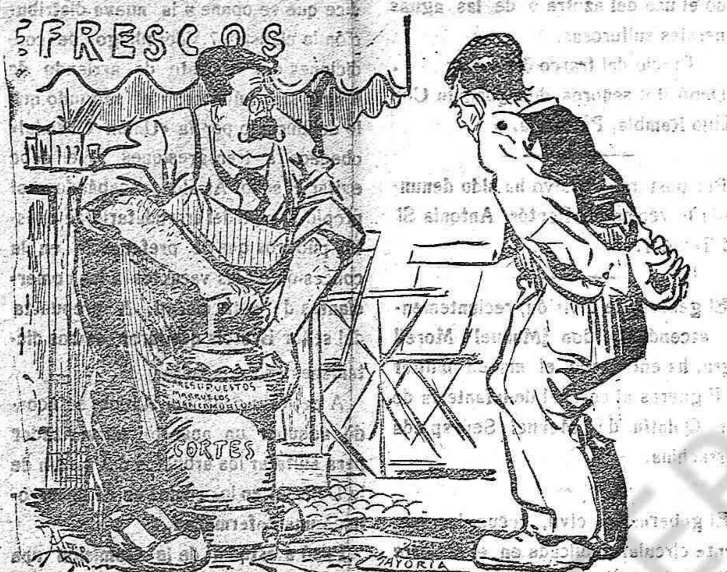
La Opinión.— Señor Pepe, pa mí que se le sale la sustancia por ese pitorro. Cana.— Con tal de que cueja lo que hay dentro.

¡Bajará desde ahora el verbo del Tradicionalismo español, continuador de la obra filosófica del eminente sacerdote catalán.