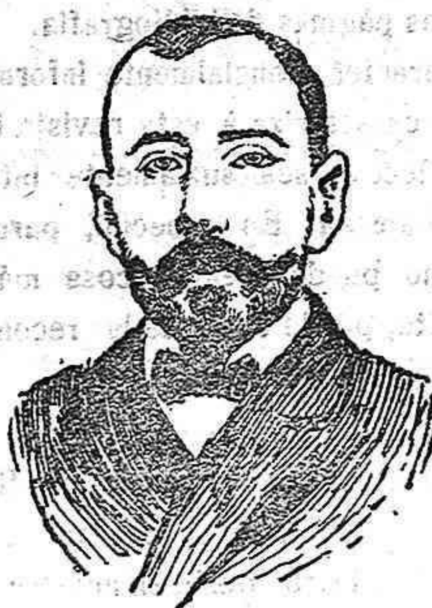
QUE HA DESCUBIERTO EL POLO SUR EL 14 DE DICIEMBRE ÚLTIMO

En estos días son innumerables los mensajes de felicitación que se reciben en el Palacio Real de Noruega de los soberanos extranjeros con motivo del descubrimiento del Polo Sur, en el cual ha tremolado la bandera de aquella nación, gracias a la intrepidez del doctor Amundsen, que es objeto de la admiración y envidia de atrevidos exploradores.