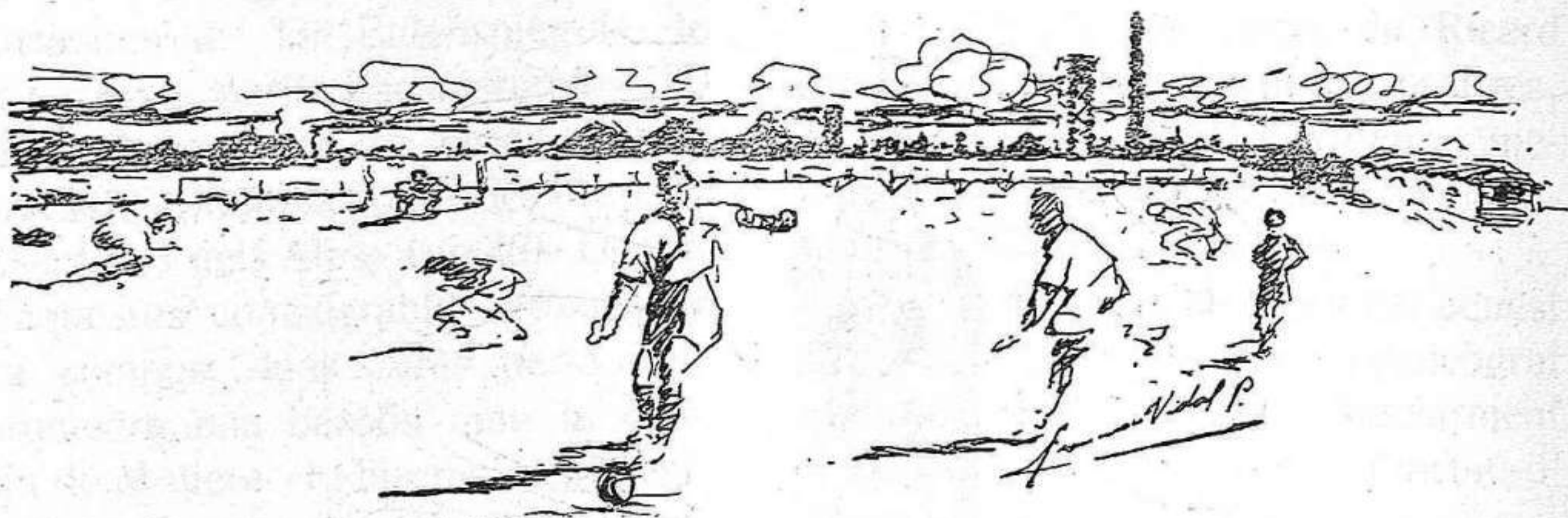
Apunt pres en el nostre camp, per F. Vidal.