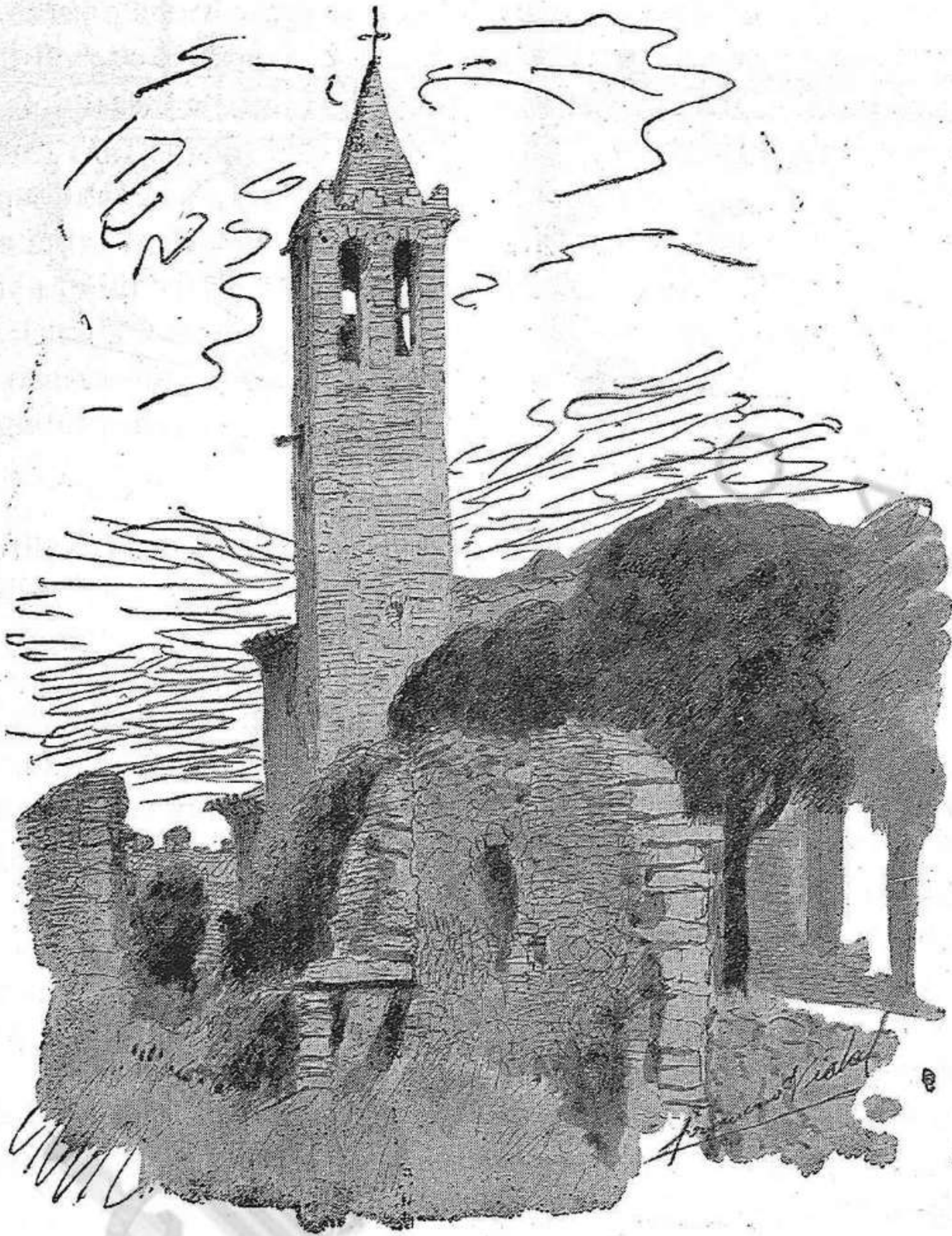
El campanar dels Sants Metges