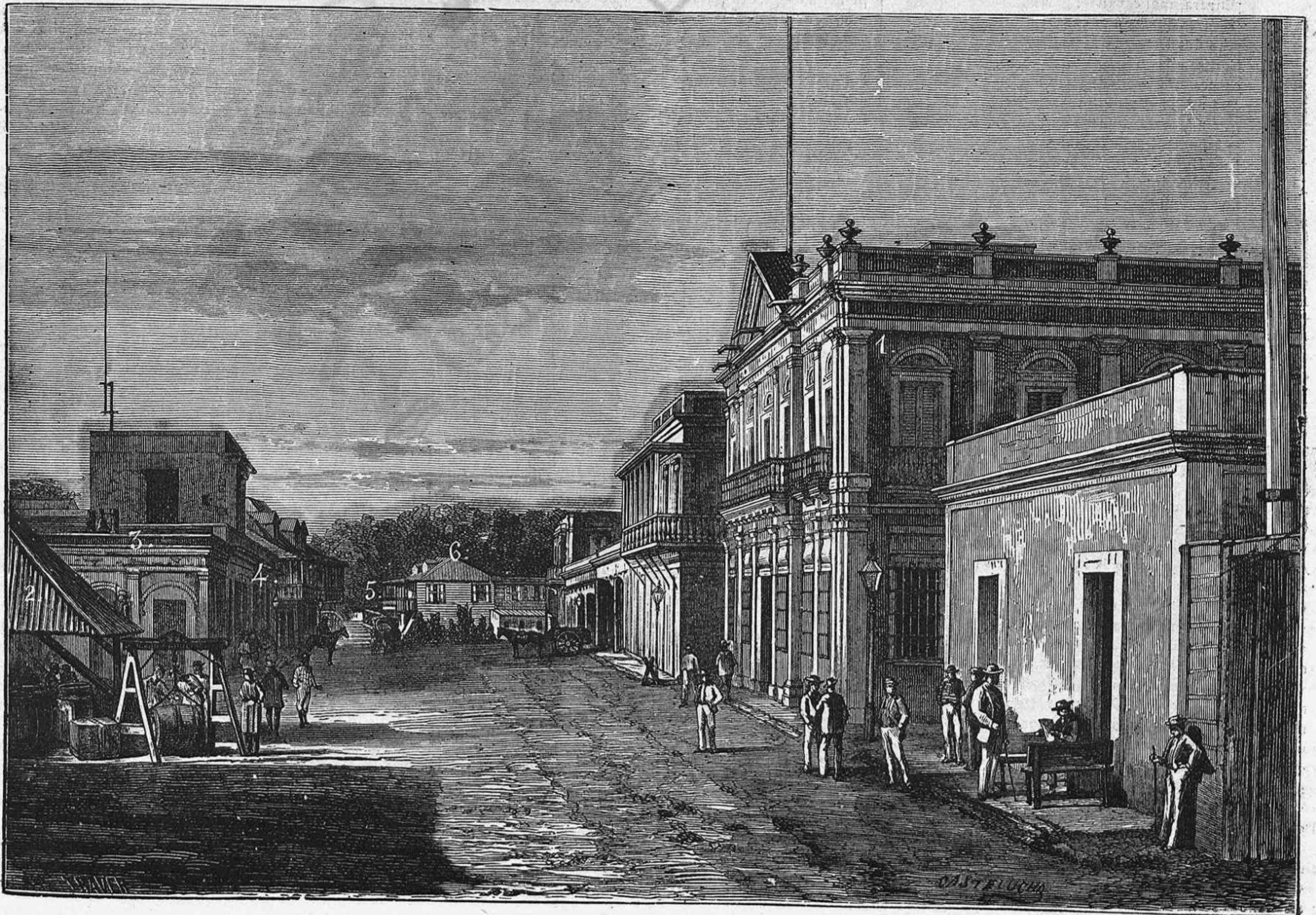
ILLA DE PUERTO RICO. — VISTA DE LA PLATJA DE LA CIUTAT DE MAYAGUEZ 1. Aduana. — 2. Tinglado pera descàrreg. — 3. Cos de guardia. — 4. Consulat italià y magatzem del senyor Tolosa. — 5. Pont en lo riu Faguas. — 6. Fonda espanyola del senyor Lopez