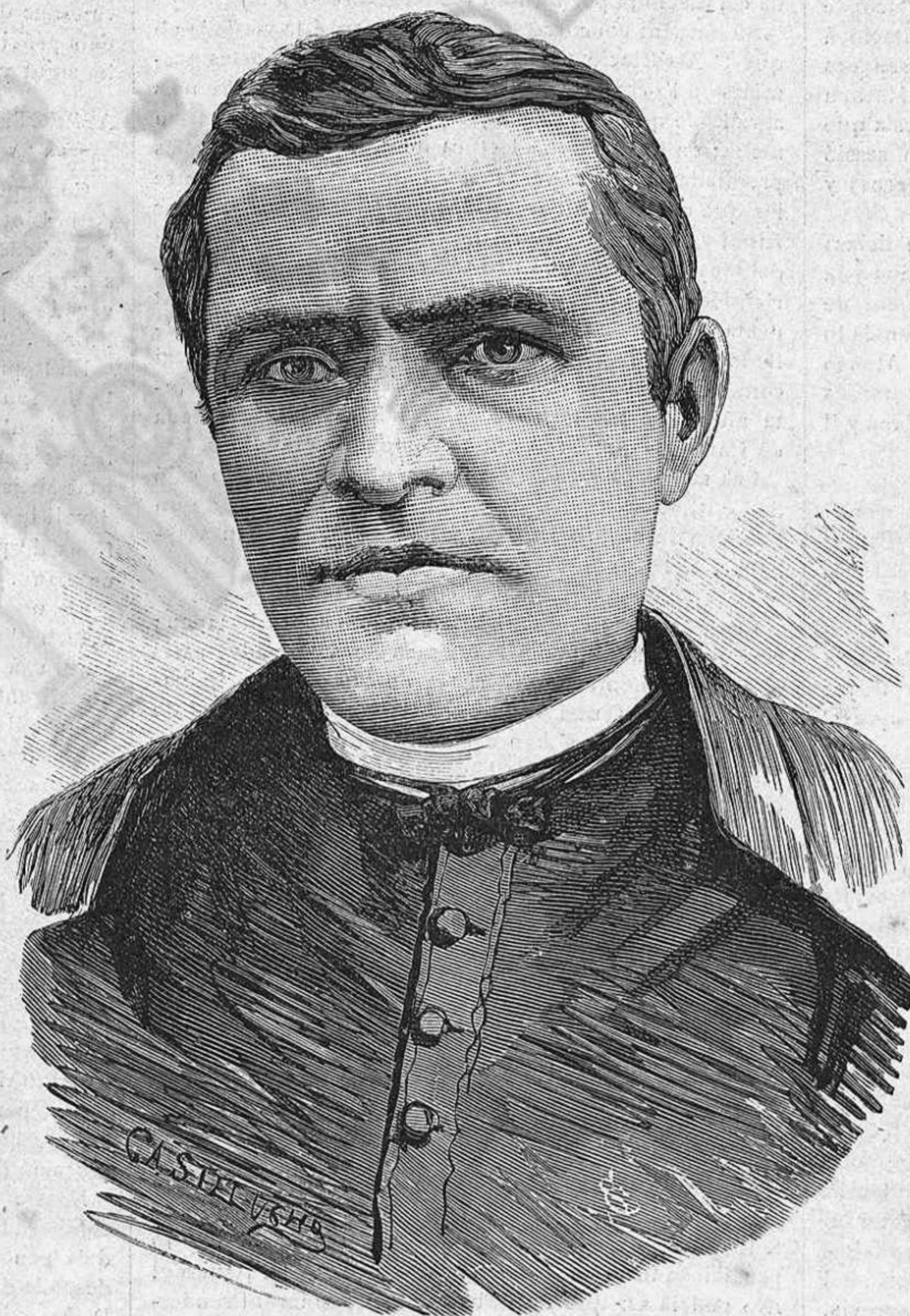
JASCINTO VERDAGUER, PBRE.

La festa del Jochs Florals s' ha celebrat enguany ab lo lluhiment y esplendor de sempre; ab aquest motiu la gran sala de contractes de la Llotja presentava un magnífich aspecte plena de gom á gom d' una numerosa y distingida concurrència, composta en sa majoria d' elegants y hermosíssimas damas y senyoretas y de quant de notable conté nostra capital en art, en lletres y en capital, qu' habíen acudit allí ansiosos de tributar l' homenatge degut al geni de la poesia, y d' assaborir las produccions capdals que l' estre de nostres primers poetas y escriptors debia haber produhit en aquesta justa tan noblement disputada. La decoració del saló encarregada als germans Vilanova, era senzilla y de bon gust; les columnas estaban adornadas ab ramatje y fullas de palmera y en diferents estandarts qu' entre ellas onejavan s' hi veyan escrits ab lletres platejadas los noms dels mestres en Gay-Saber. L' estrado destinat á las autoritats, comissions, al Consistori y als senyors adjunts s' habia colocat