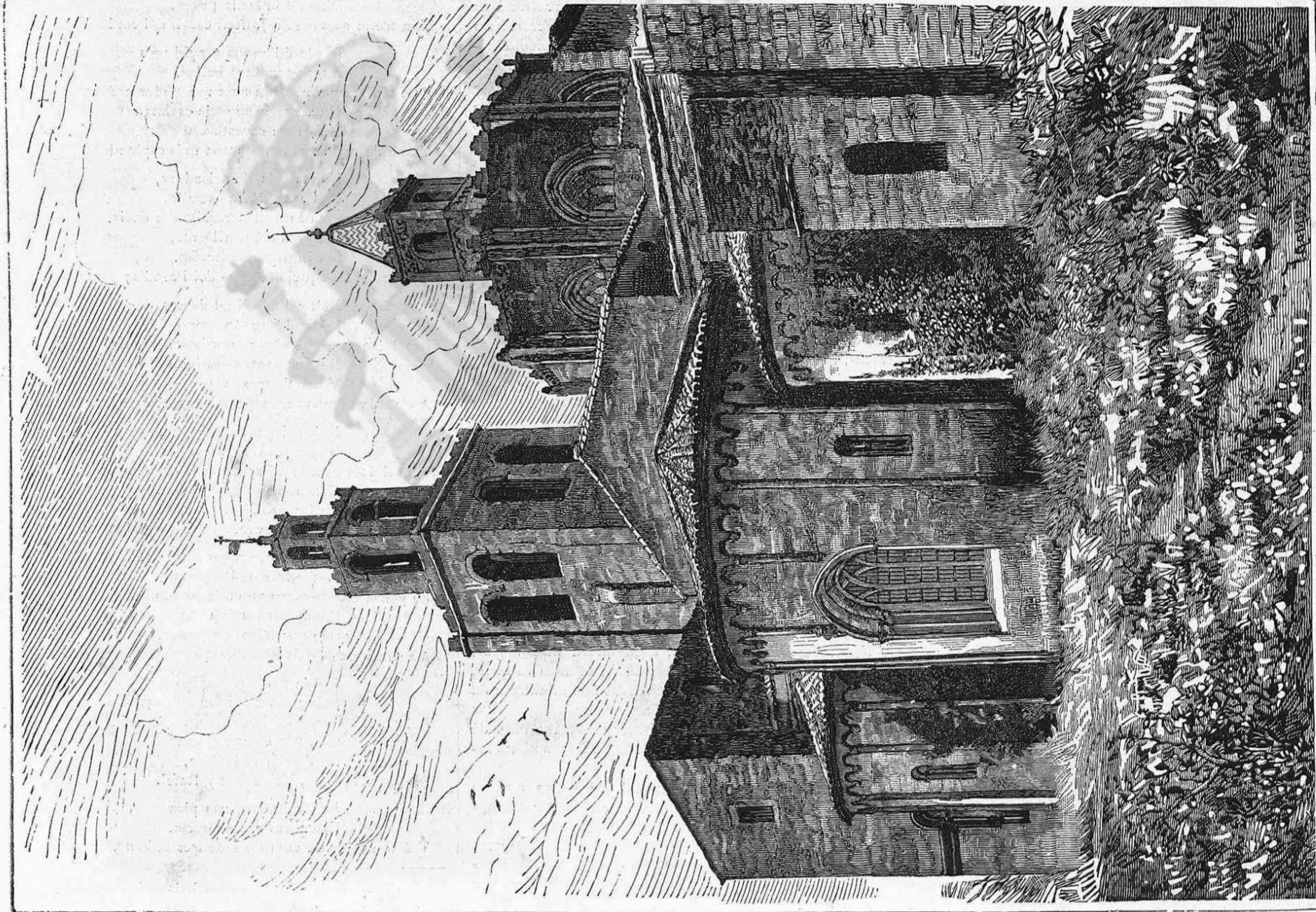
VISTA POSTERIOR DE LA IGLESIA DEL MONASTIR DE SANT CUGAT DEL VALLÈS (DE HELIOGRAFIA DE JOARITZI Y MARIEZCURRENA)