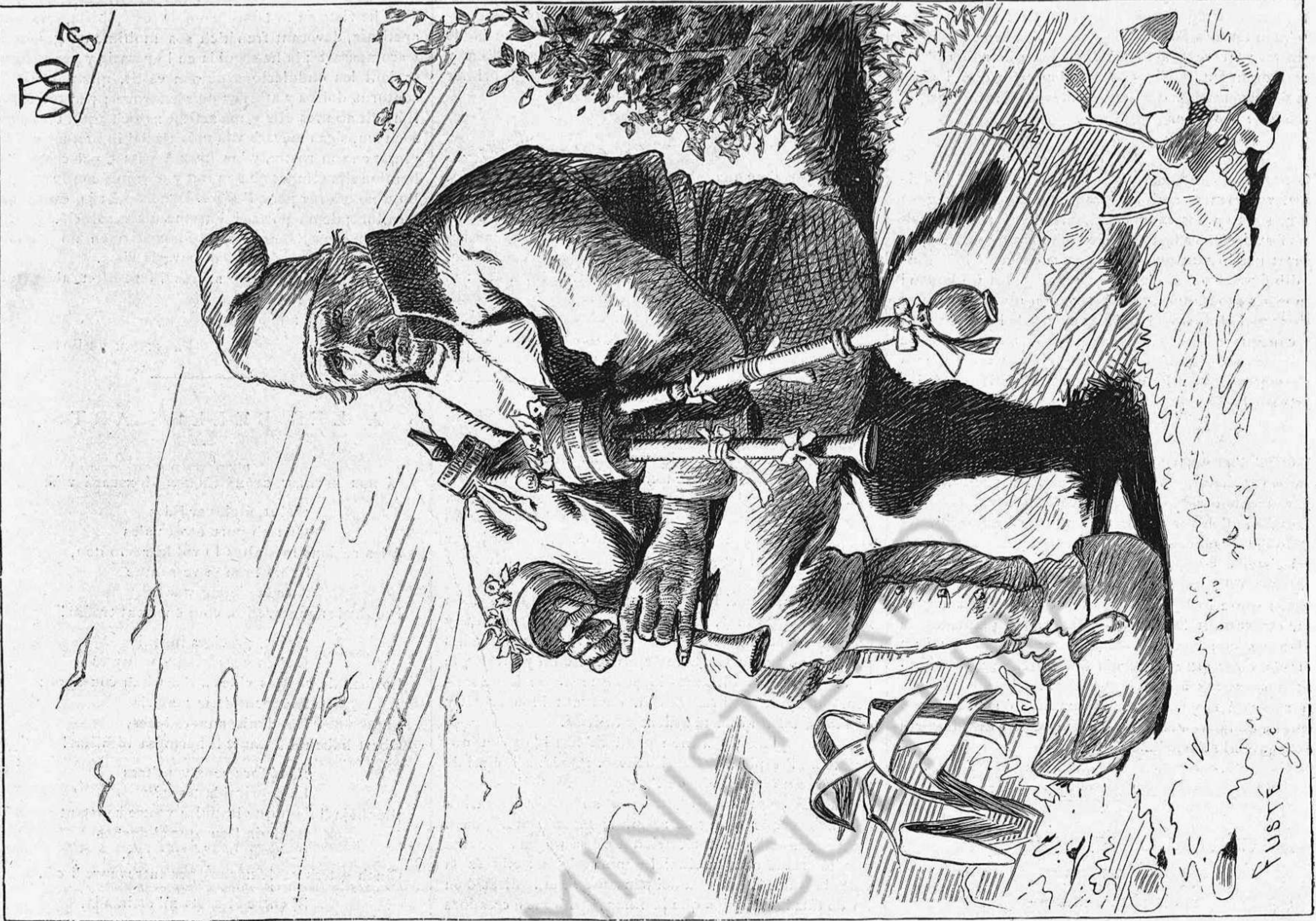
LO DOLSAINER COMPOSICIÓ DE APELES MESTRES