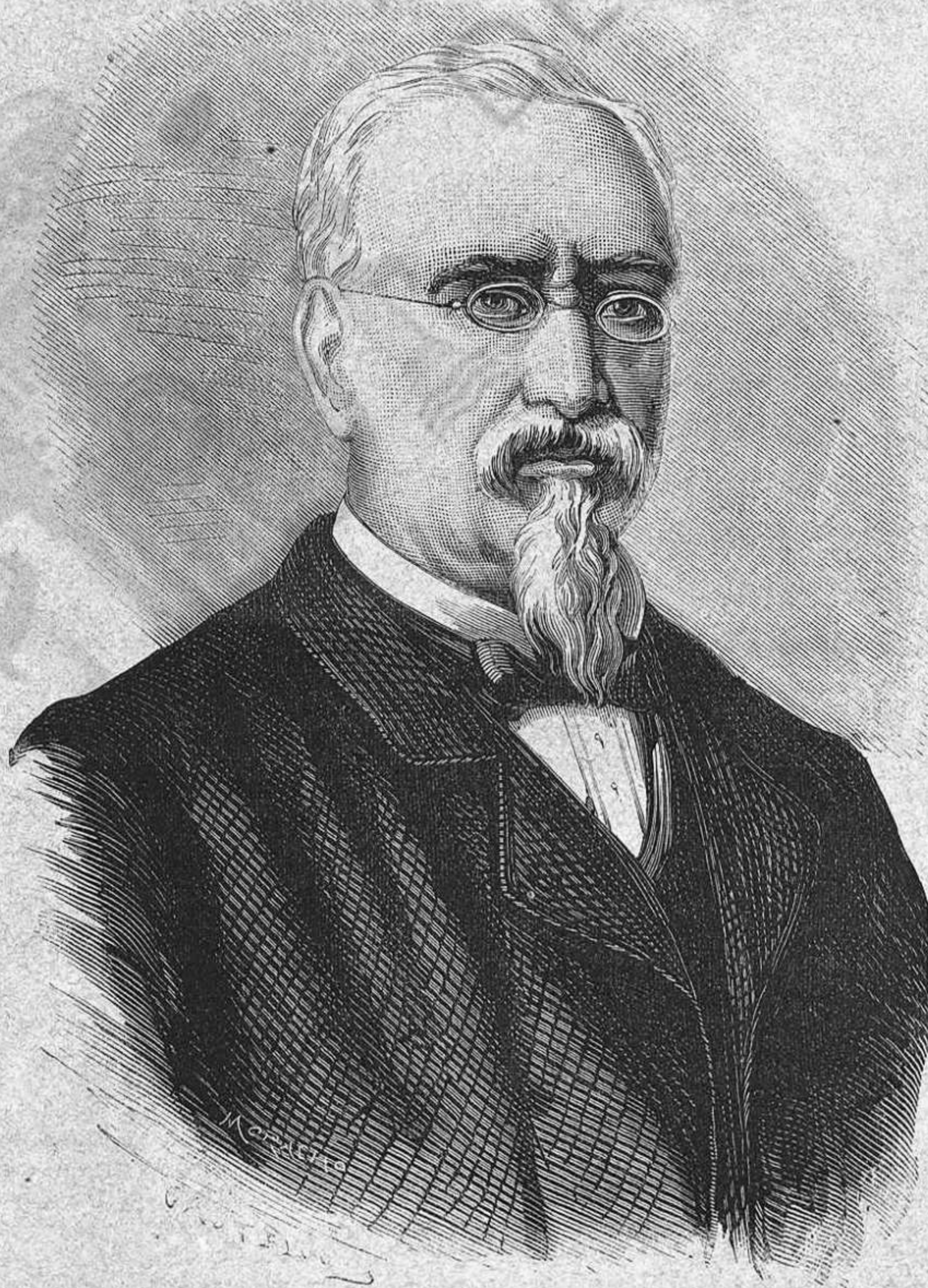
DON VICENS BOIX Y RICARTE † en Valencia lo 7 de Mars de 1880 DIBUIJ DE CASTELUCHO — GRABAT PER MORACHO

Decret anunciat ja tan temps feya, pensavam que vindria d' un cop á portar á la ensenyansa las saludables reformas de que tan necessitada n' está en nostre concepte y hem de confesar que nos havém enganyat per complert. Lo nou decret en sustancia no ve sinó á modificar lo número d' assignaturas en las facultats y aixó al fi y al cap no es cap remey per curar la defectuosa organisació general de l' ensenyansa. L' augment d' assignaturas en algunas carreras, lo que farà, tot lo més, será posarlas més caras y ménos aseguibles als estudiants, fills en sa majoria de familias de fortuna modesta, que ben clar diu l' observació més senzilla que la ciencia no s' ha fet pas regularment pels millonaris. Si 'l Govern creya qu' eran