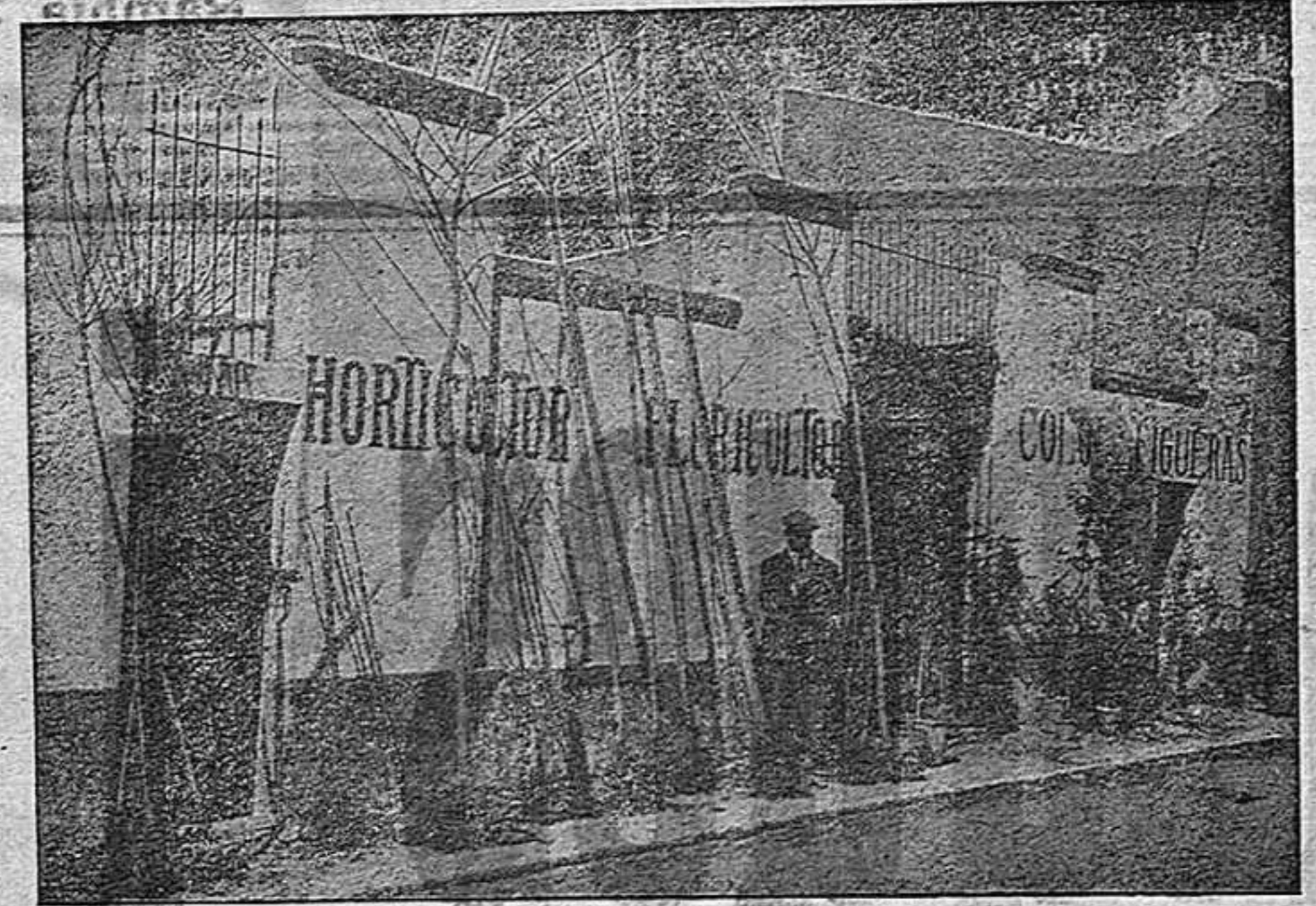
Vista de la façana del jardí i despatx de la CASA SOLÀ-Carrer Colón, 9-FIGUERES Sol·liciti's catàleg que s'enviarà gratuïtament

La Casa Solà posa en coneixement de sa immensa clientela que des de primers d'octubre té a la venda tota la col·lecció d'Arbres Fruïters, Arbustesi Arbres en general.