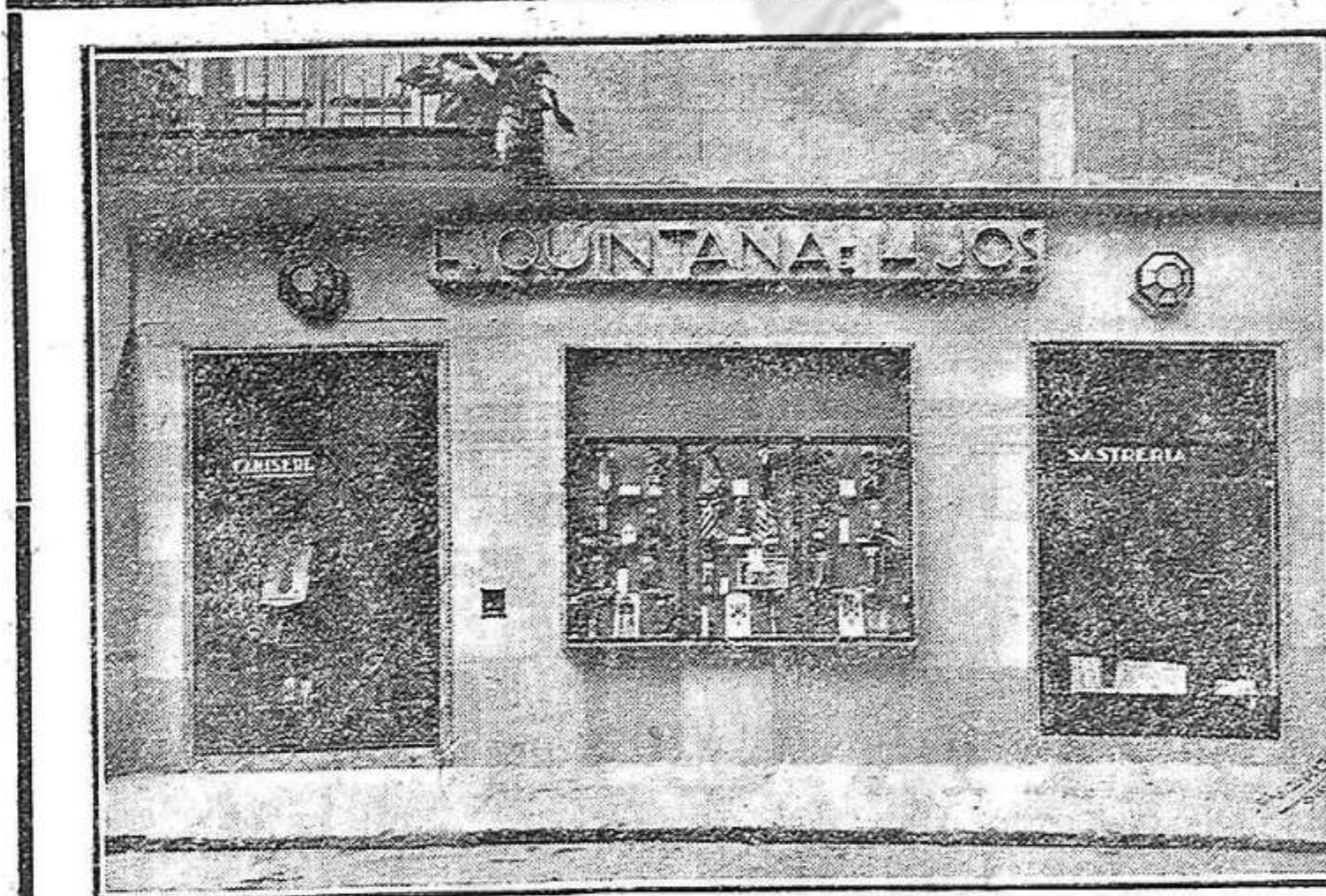
Plaça de les Castanyes - GIRONA

I jo tinc la seguretat que si aquest senyor hagués anat a buscar el tikit ans del dia segurament no s'hi hauria trobat; es allò dels republicants de última hora que quan han vist el triomf tots han sigut revolucionaris.