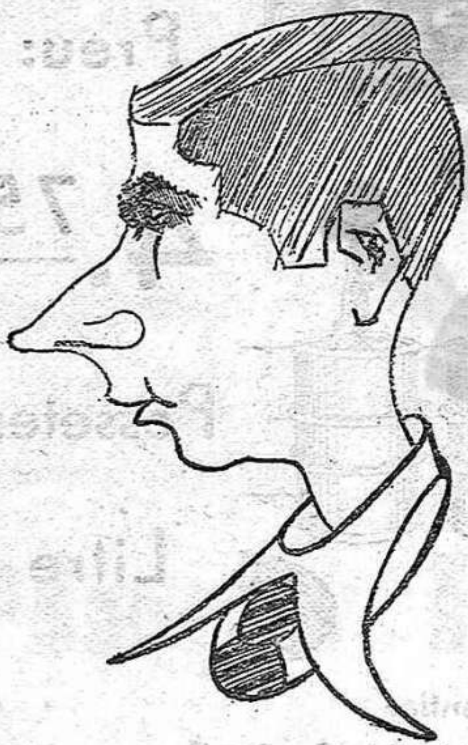
EN JOSEP FELIP vist per K. S. A.

He millorat aquest any tots els rècords de Reus en braça de pit, de 17" 2-5, el del 100 m. de 56" 1-5 el dels 200 i he deixat a fi de tem-