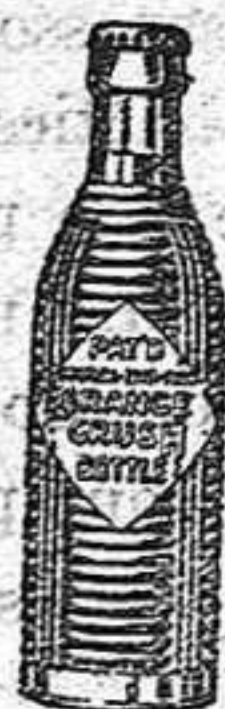
(Marca, botella y nombre registrados)

Exija siempre la botella original y rechace imitaciones.