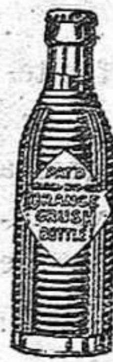
(Marca, botella y nombre registrados)

Exija siempre la botella original y rechace imitaciones.