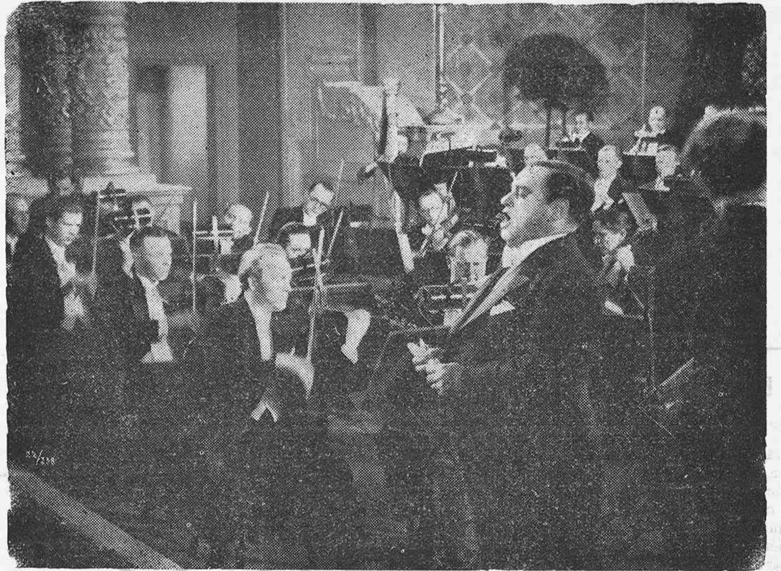
Uno de los instantes de mayor lucimiento del tenor Benjamino Gigli, en la interesante producción de "Cifesa", "No me olvides".

Durant el mes de Novembre últim els assistents al Cinema han passat de 87.000.000. Quants d'ells han rebut el mal exemple de les cintes immorals?