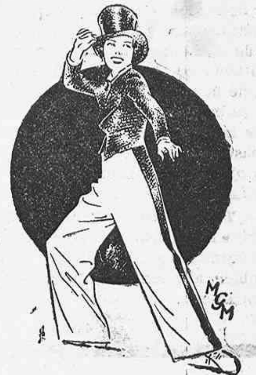
La nueva estrella Eleanor Powell

mi, ni contrato con cualquier casa productora que no me ofreciera garantías de perfección. No se luchan años enteros para conquistar una personalidad y tirarla luego por la borda por una ligereza... Pe-