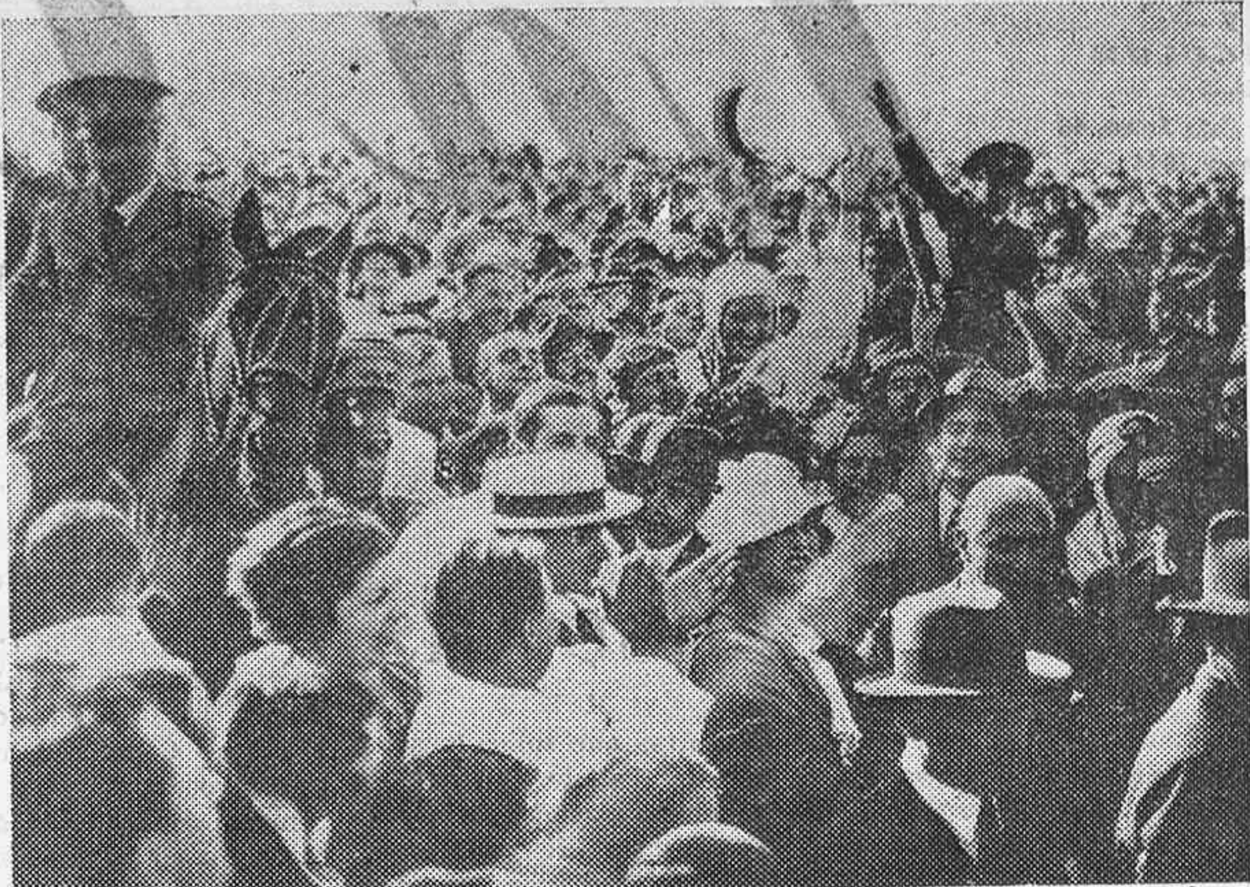
La célebre aviadora Jean Batten ha sido recibida con gran entusiasmo a su llegada a Buenos Aires, después de haber realizado la travesía del Atlántico sola a bordo de un avión, desde Dakar a Natal. La policía tuvo grandes dificultades para hacer paso a la célebre aviadora. Momento de la llegada de Jean Batten.