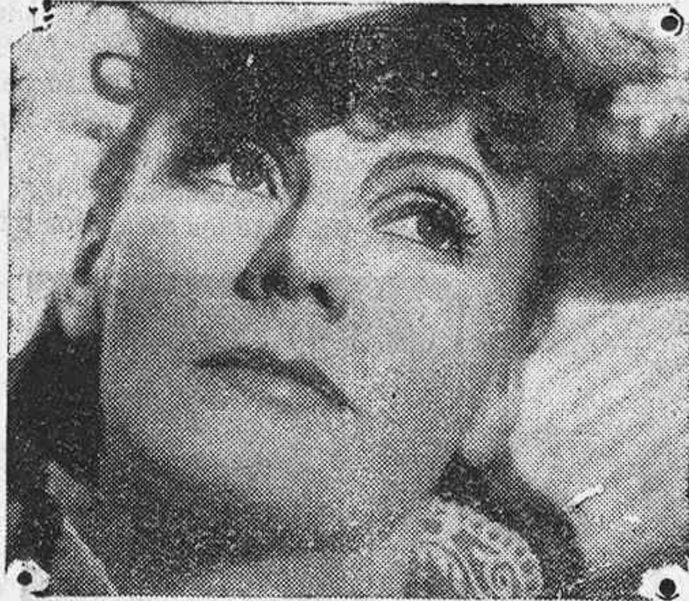
La cara de Greta Garbo es un modelo de expresión

Es cierto, sin duda alguna, que el alma de Greta Garbo permanece hermética para nosotros, pero no