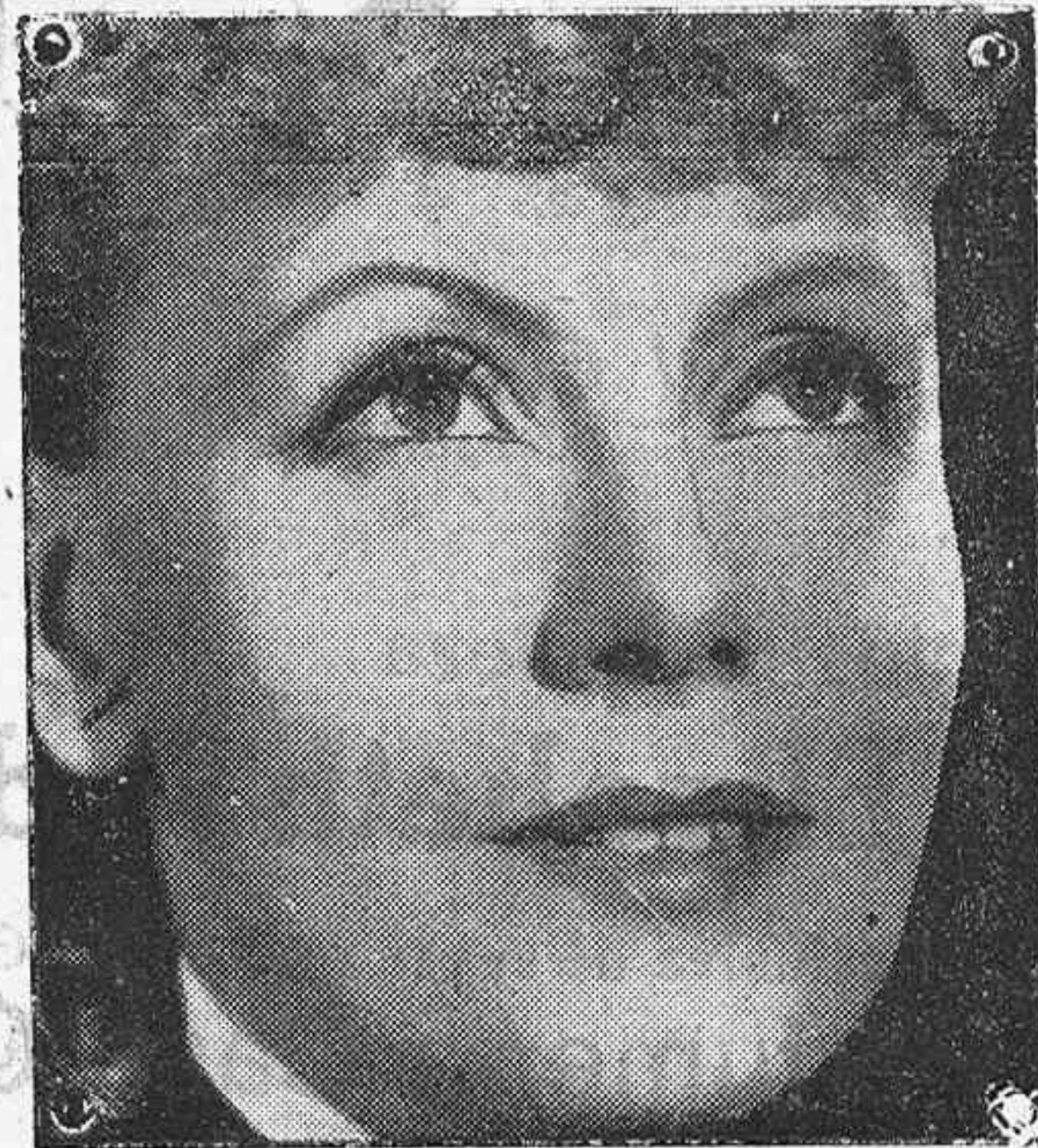
Otro aspecto enigmático de la gran actriz

La mayoría de las estrellas cinematográficas exponen al mundo los escapates abiertos y bien iluminados, brindándole no solamente la expresión de su talento artístico sino también las aventuras más o