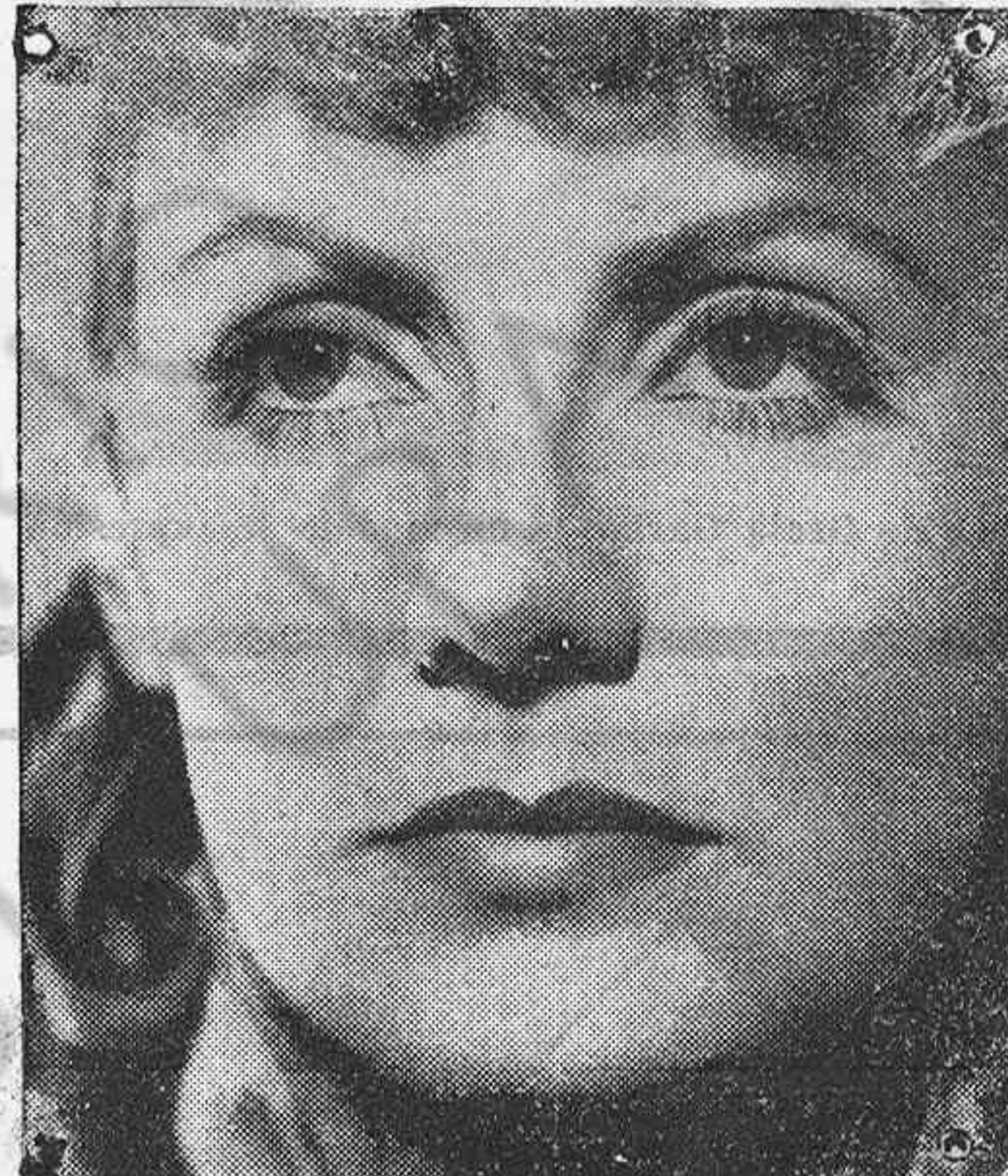
El enigma de Greta

Son contadísimas las personas que pueden jactarse de haberla hablado en cualquier lugar de reunión durante los diez años transcurridos