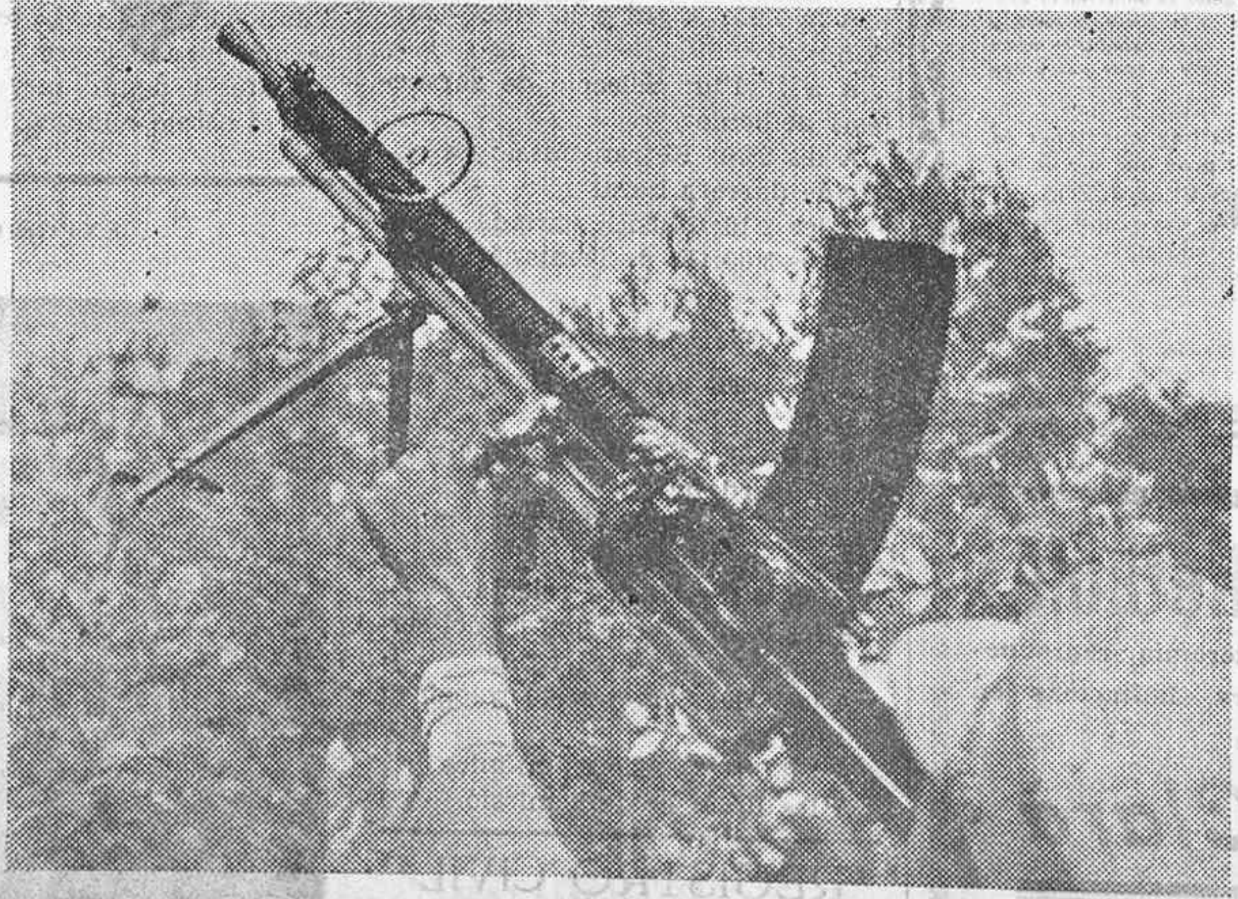
En las afueras de Addis-Abeba, capital de Abisinia, los soldados hacen los últimos ensayos con ametralladoras modernas antes de salir para el campo de batalla para hacer una gran resistencia a la invasión italiana. El ejército etíope practicándose con las ametralladoras, preparándose para una segunda batalla en Adora.

¡Lector Ja ets subscriptor de «LA CRUZ»?