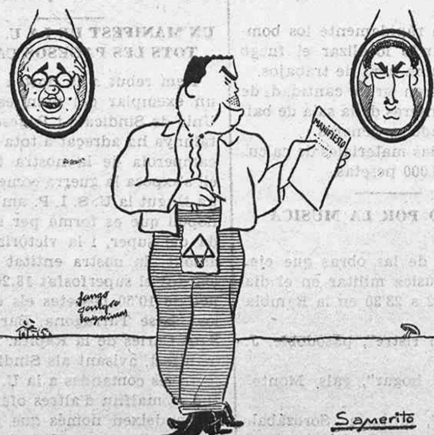
TRES ERAN TRES... M. BARRIOS. -- Pues señor, no quise ser segundón y ahora soy tercerón..

Persona afecta a señor Azaña ha manifestado que el ex presidente del Consejo, por el momento, no realizará el viaje anunciado a Barcelona y al extranjero. Ha dicho también que el libro escrito por ex presidente del Consejo, relativo a Cataluña, será puesto a la venta en breve.