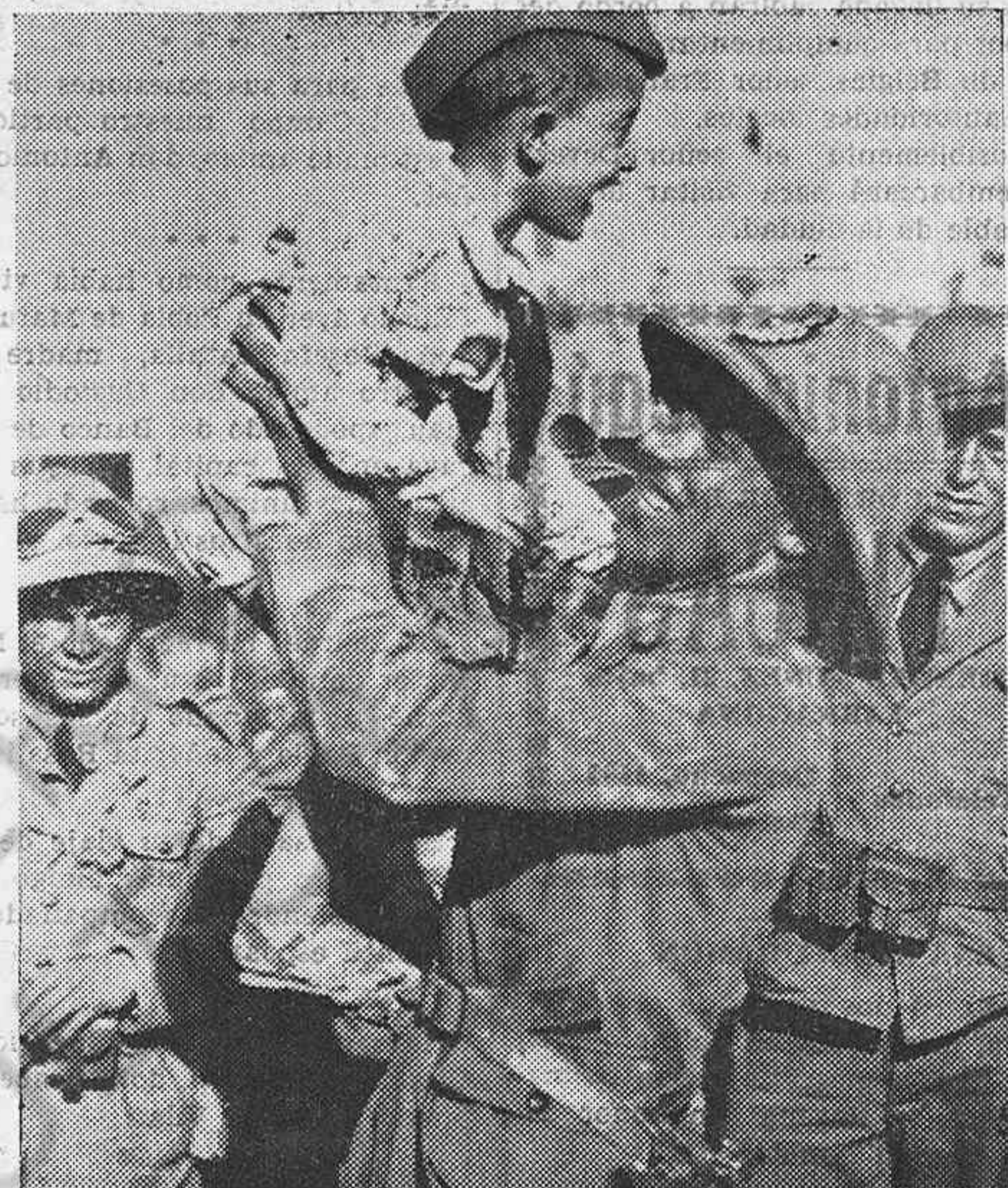
Un soldado italiano, uno de los muchos que diariamente salen con rumbo al Africa del Este, despidiéndose de su hijito. (Fotografía mandada por avión desde Nápoles).