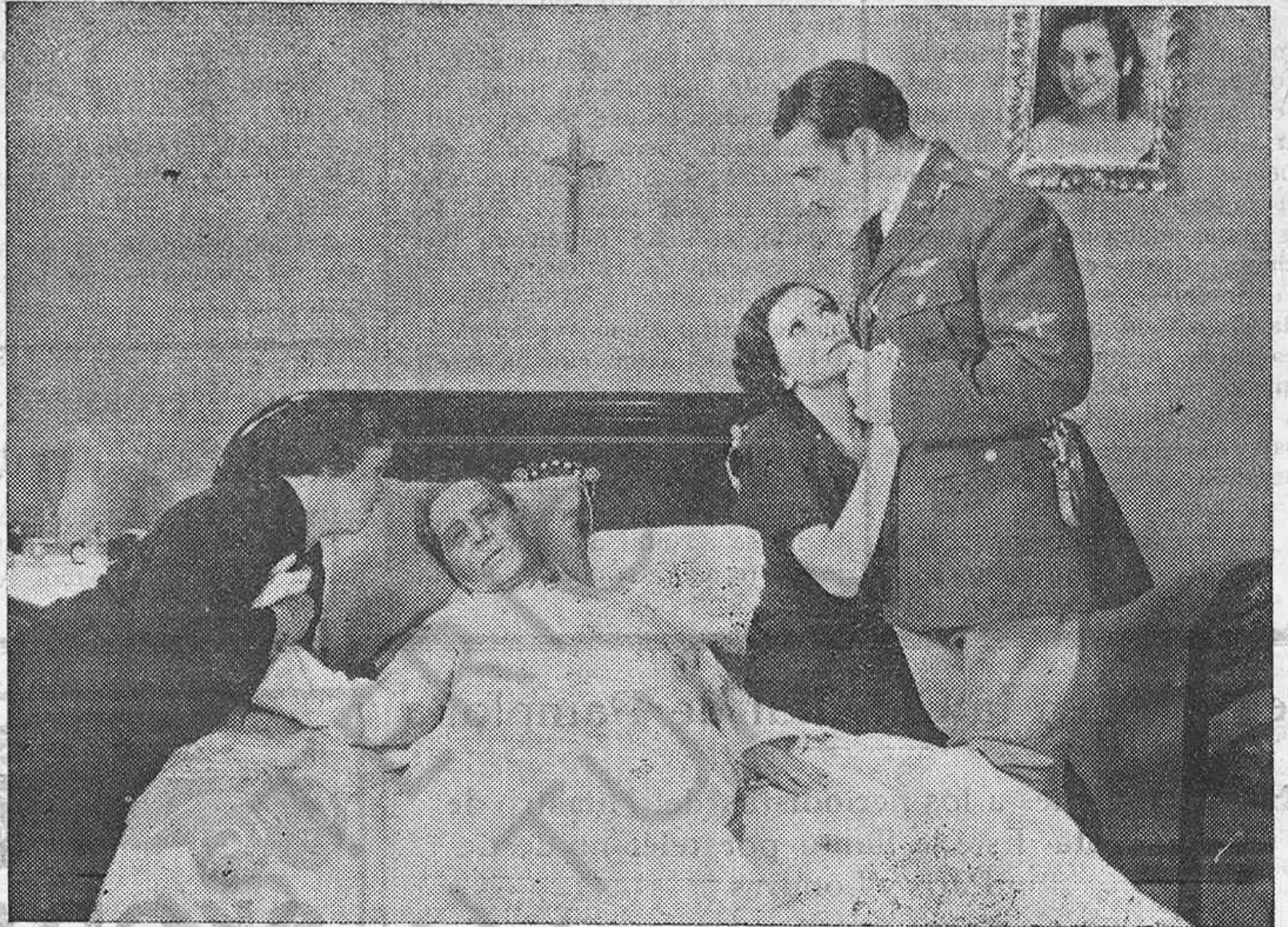
Una de las interesantes escenas de la producción mejicana EL VUELO DE LA MUERTE que distribuye la prestigiosa entidad valenciana CIFESA.