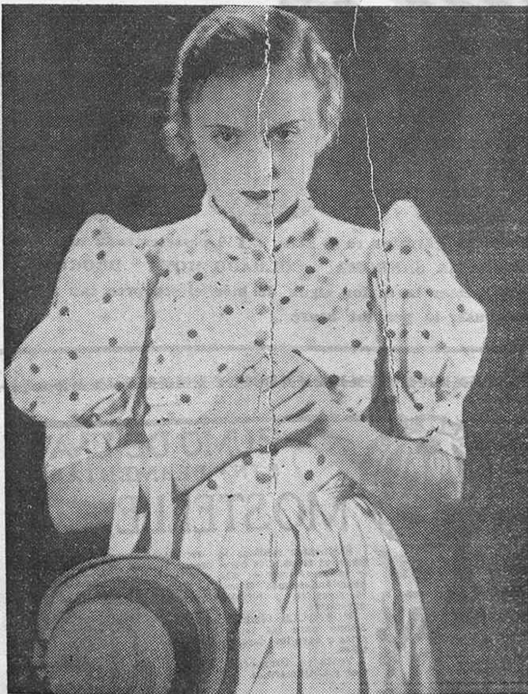
REGINA la candorosa muchacha de pueblo que en aras de un ferviente amor logró ceupar un puesto en la más encumbrada sociedad, siendo víctima de perfidias e intrigas que mancharon su candor y deshicieron su hogar, REGINA es un flim distribuido por CIFES.