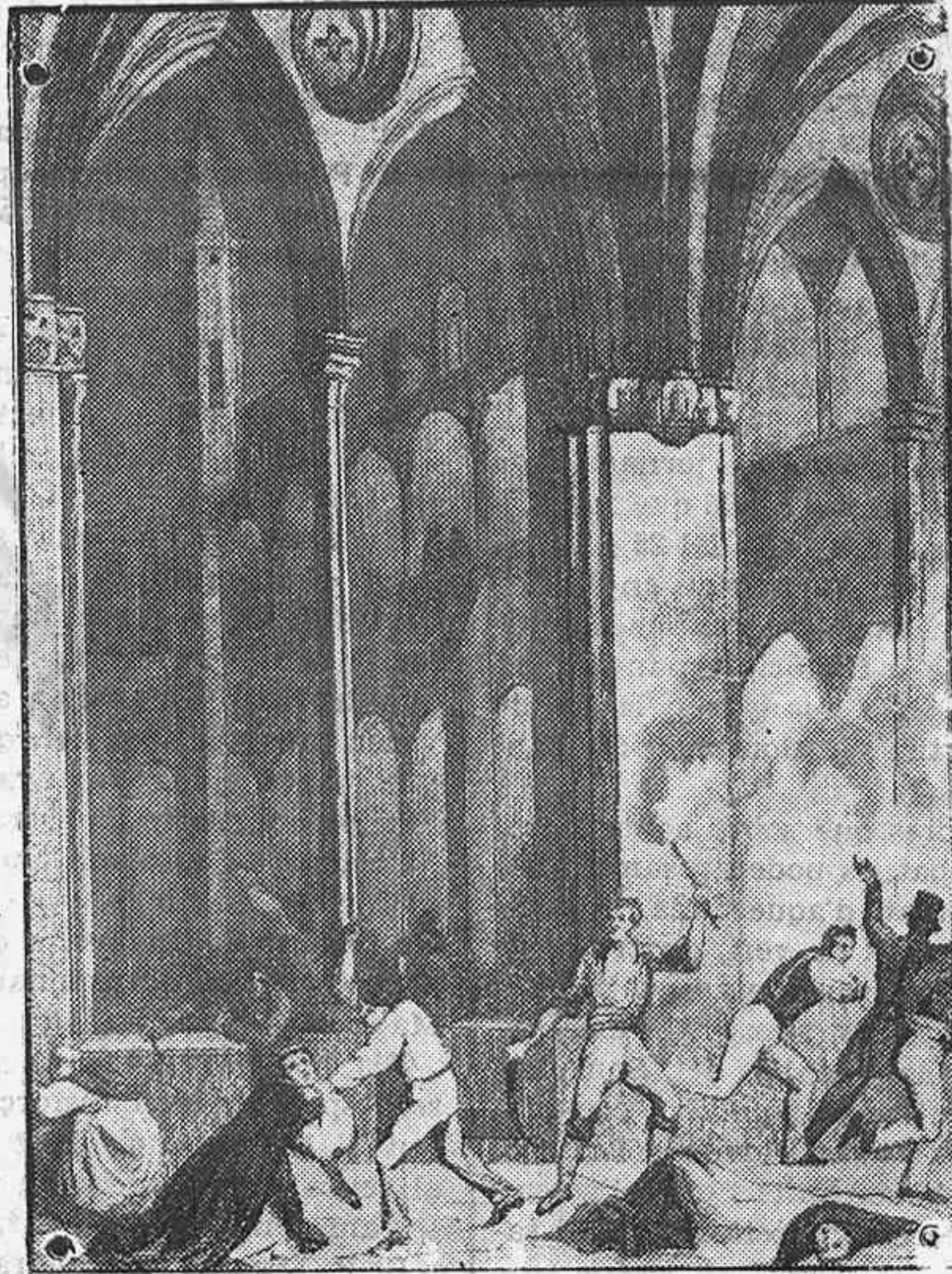
Una altra tràgica escena

Rodejaren el convent, i amb feixos de llenya cremaren les portes; entraren a l'edifici donant al foc i destruint tot allò que trobaren al pas, i solament salvaren el celler i el rebost per aprofitar-se dels queviures que hi tenien guardats els religiosos. A l'església apilaren al mig de la nau tots els objectes combustibles: altars, tarimes, confesso-