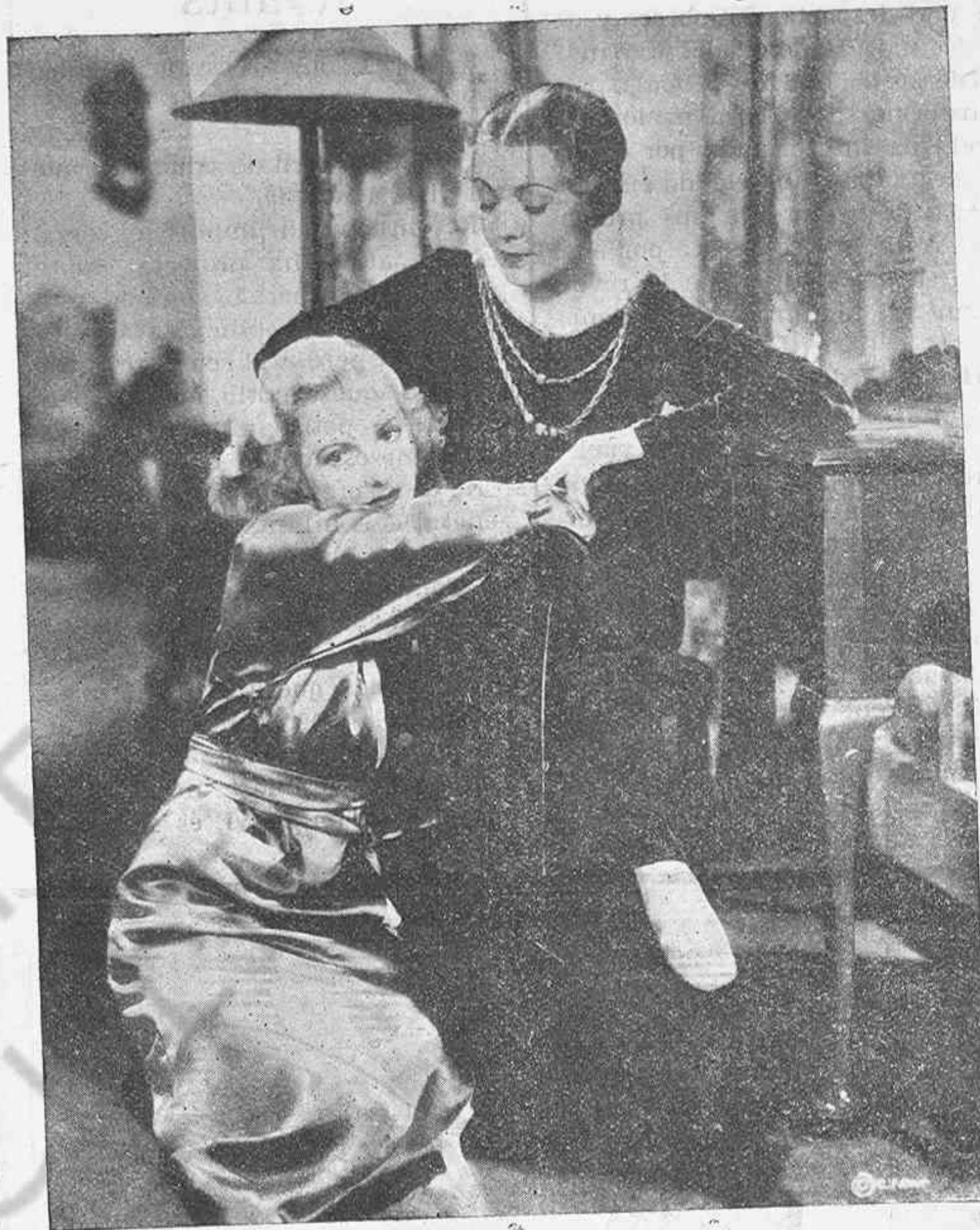
Una escena de la película "El remolino" de CIFESA