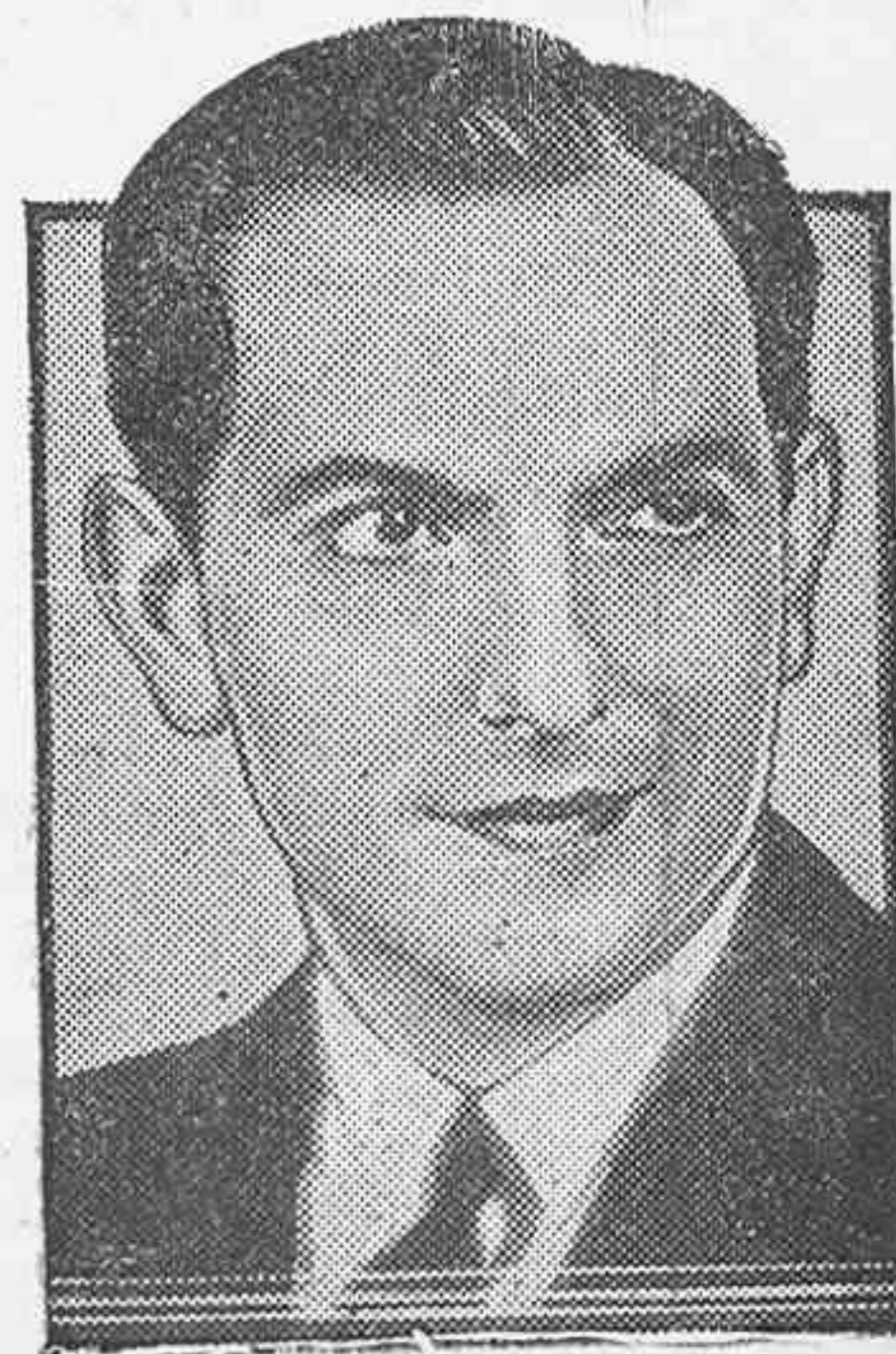
Josep Schildkraut, galán de la producción Columbia-Cifesa "La mujer de mi marido"

Se ha acordado que en la Exposición general francesa de 1937 sea emitido un sello (de franqueo) Luis Lumière.