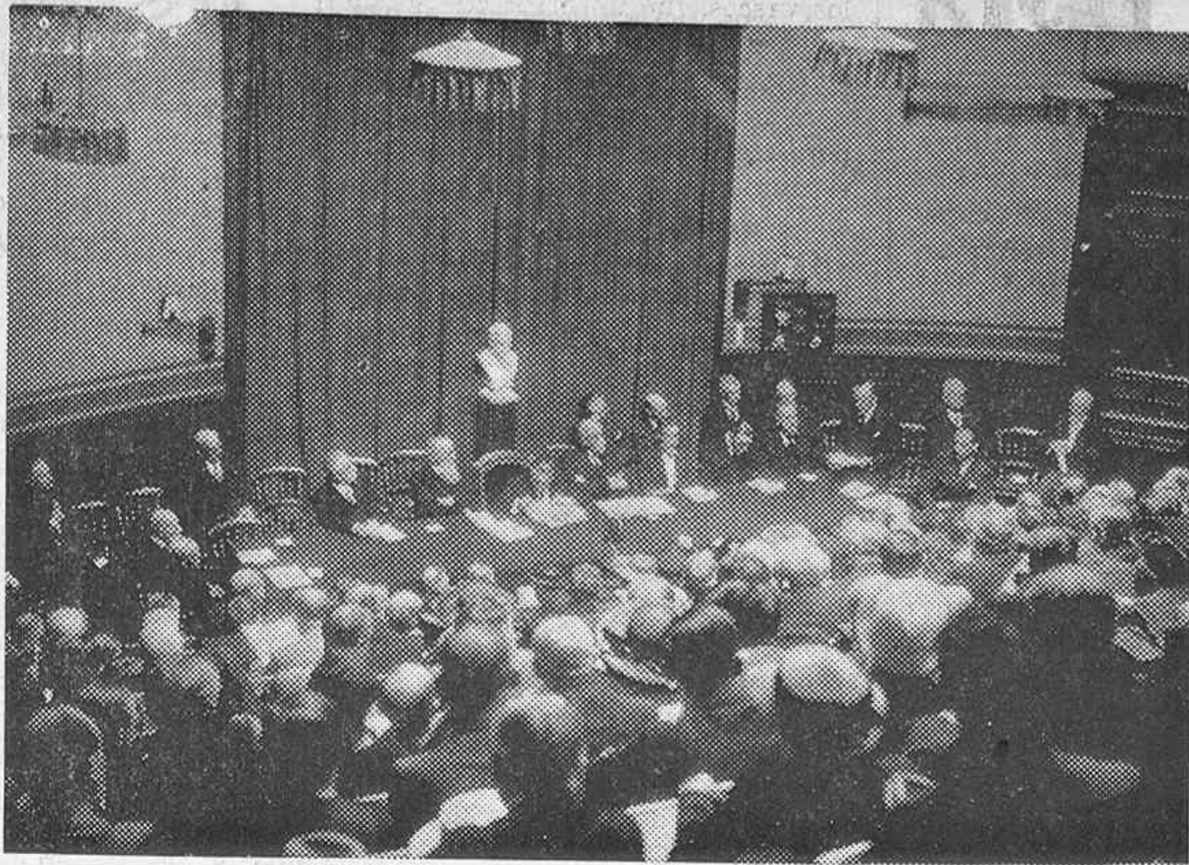
Recientemente una emocionante ceremonia ha tenido lugar en el Instituto Pasteur de París con motivo de celebrarse el cincuentenario de la aplicación de la vacuna contra la rabia, a la humanidad, en presencia del Sr. Ernesto Lafont, ministro de Sanidad.