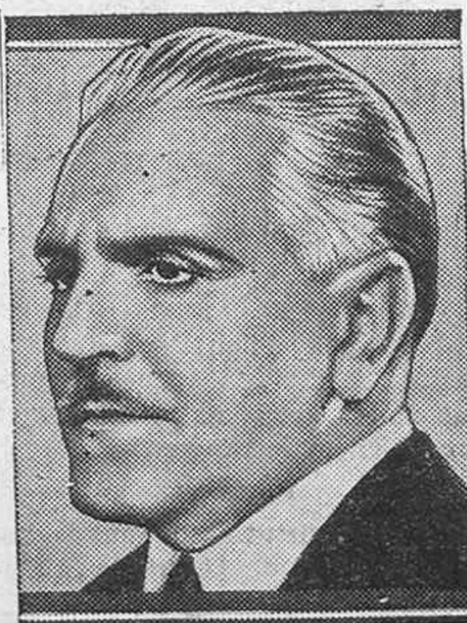
Frank Morgan, famoso actor que actúa con éxito en el film de Cifesa "La mujer de marido"

Contràriament a tot el que ha estat anunciat, encara no tinc el títol d'aquesta producció, ni tan sols l'he cercat. Podem anomenar-la, però, "Producció número 5" per comoditat. Més tard, quan el film sigui completament muntat, escolliré una altra apel·lació. Aquest comptarà de vuit a nou bobines, o sia una llargària de 2.400 a 2.700 metres."