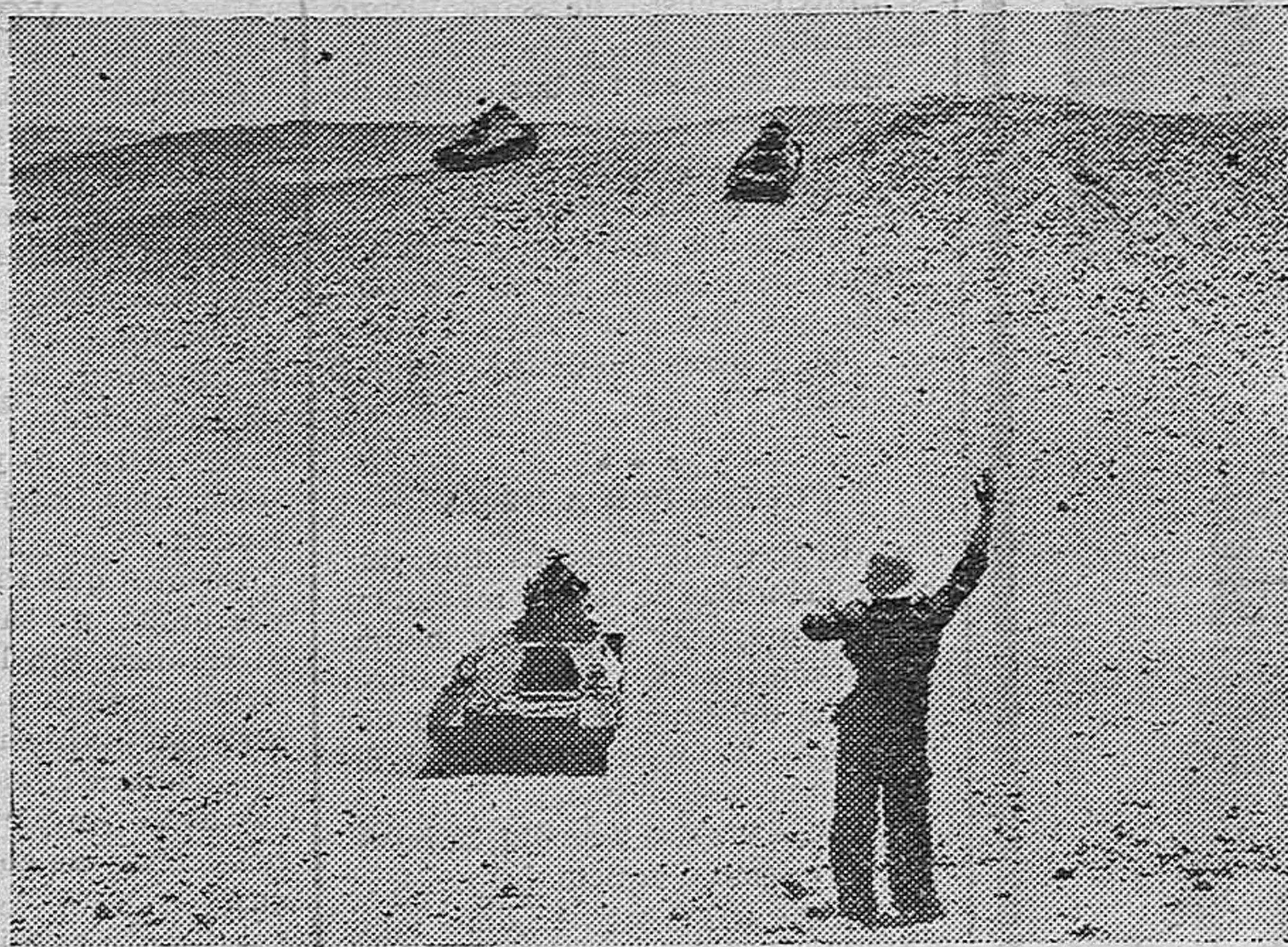
Cerca de El Cairo, en el desierto egipcio el 8.º batallón de la fuerza armada está realizando grandes maniobras secretas. El ejército británico ha trasladado allí sus mayores tanques, pesando más de 15 toneladas sin estar cargados. Vista tomada de las maniobras de los tanques ingleses más ligeros, ningún espectador obtuvo el permiso de presenciar estas maniobras. Esta fotografía ha pasado por el Ministerio de la Guerra británico, obteniendo permiso para su publicación.