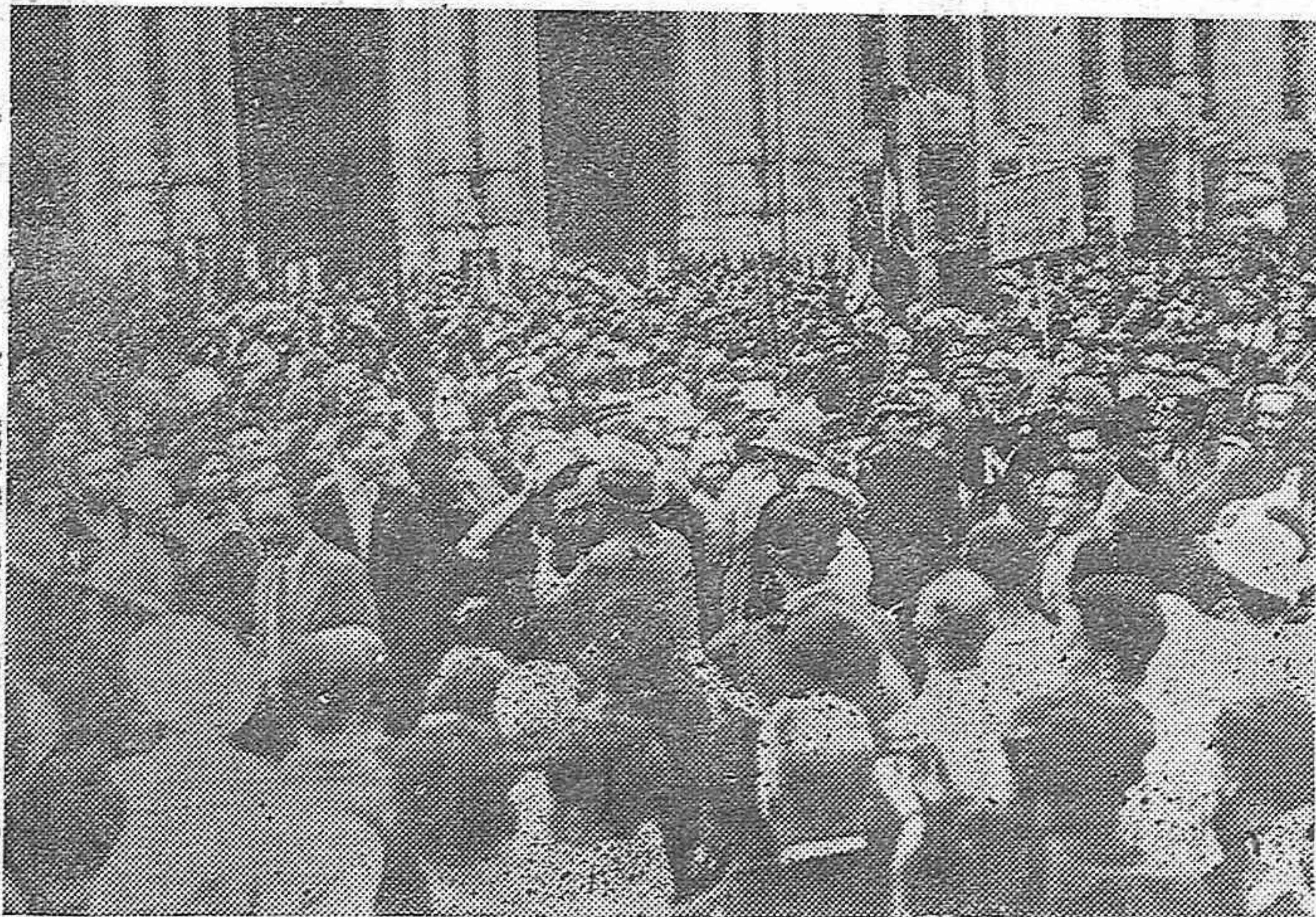
Poco a poco van llegando a Italia, vapores cargados de tropas fascistas que vuelven a Italia después de su campaña italo-abisinia, para reunirse nuevamente con sus familiares. La llegada de la tropa es objeto de grandes pruebas de entusiasmo. La llegada de los voluntarios universitarios a Milán.