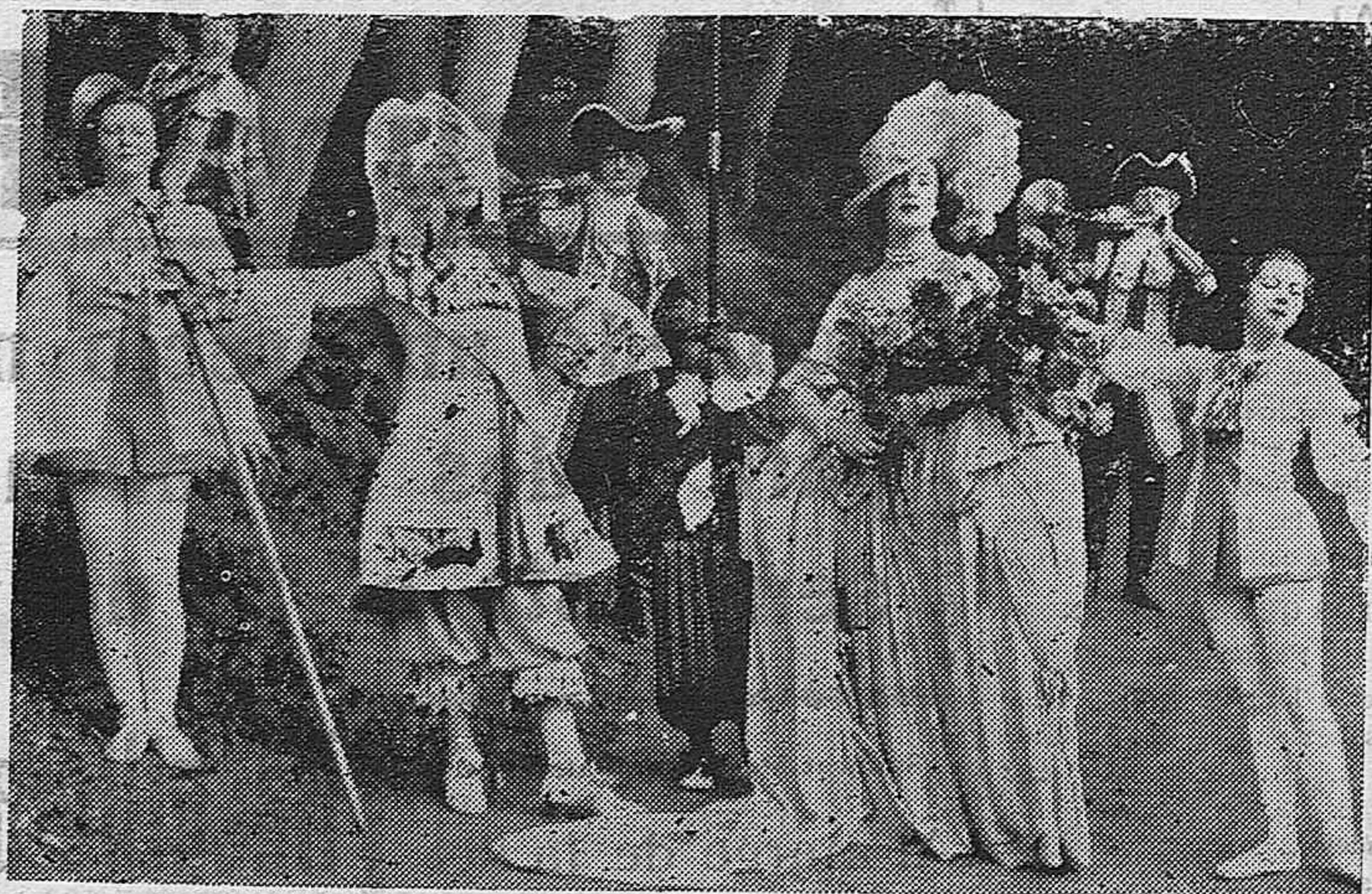
Para celebrar el centenario de Mme. Becheau La Font, se han celebrado unos conciertos históricos de música antigua en los famosos jardines nacionales de Marly. Célebres artistas de la Opera Comique que tomaron parte en la magnífica fiesta que tuvo como marco perfecto los jardines de Marly.