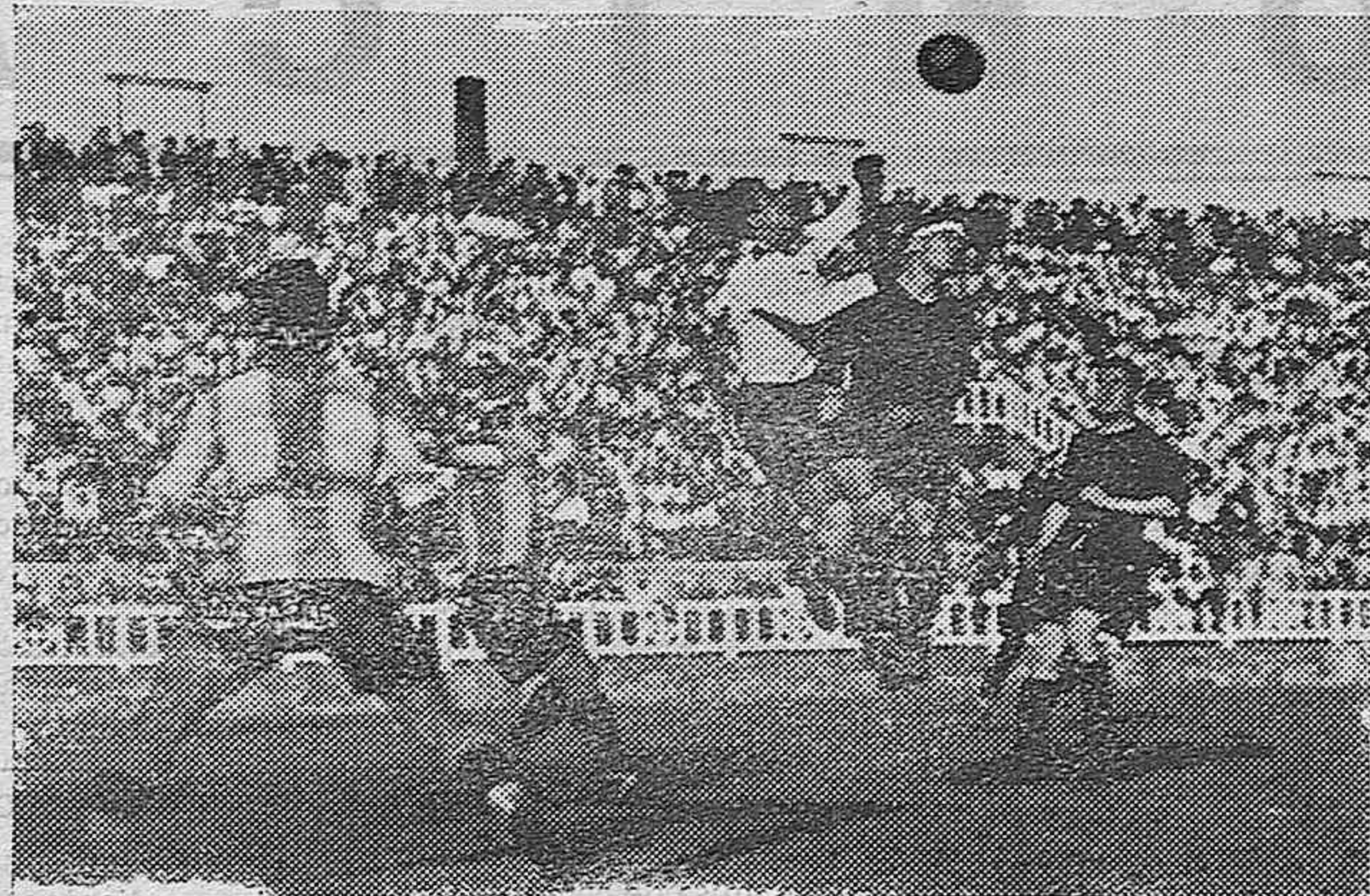
En el campo de las Corts tuvo lugar el lunes un partido de fútbol como final de la temporada entre el "Español" y el "Barcelona", con un resultado de 3 a 1 a favor del Barcelona. Un momento del partido.