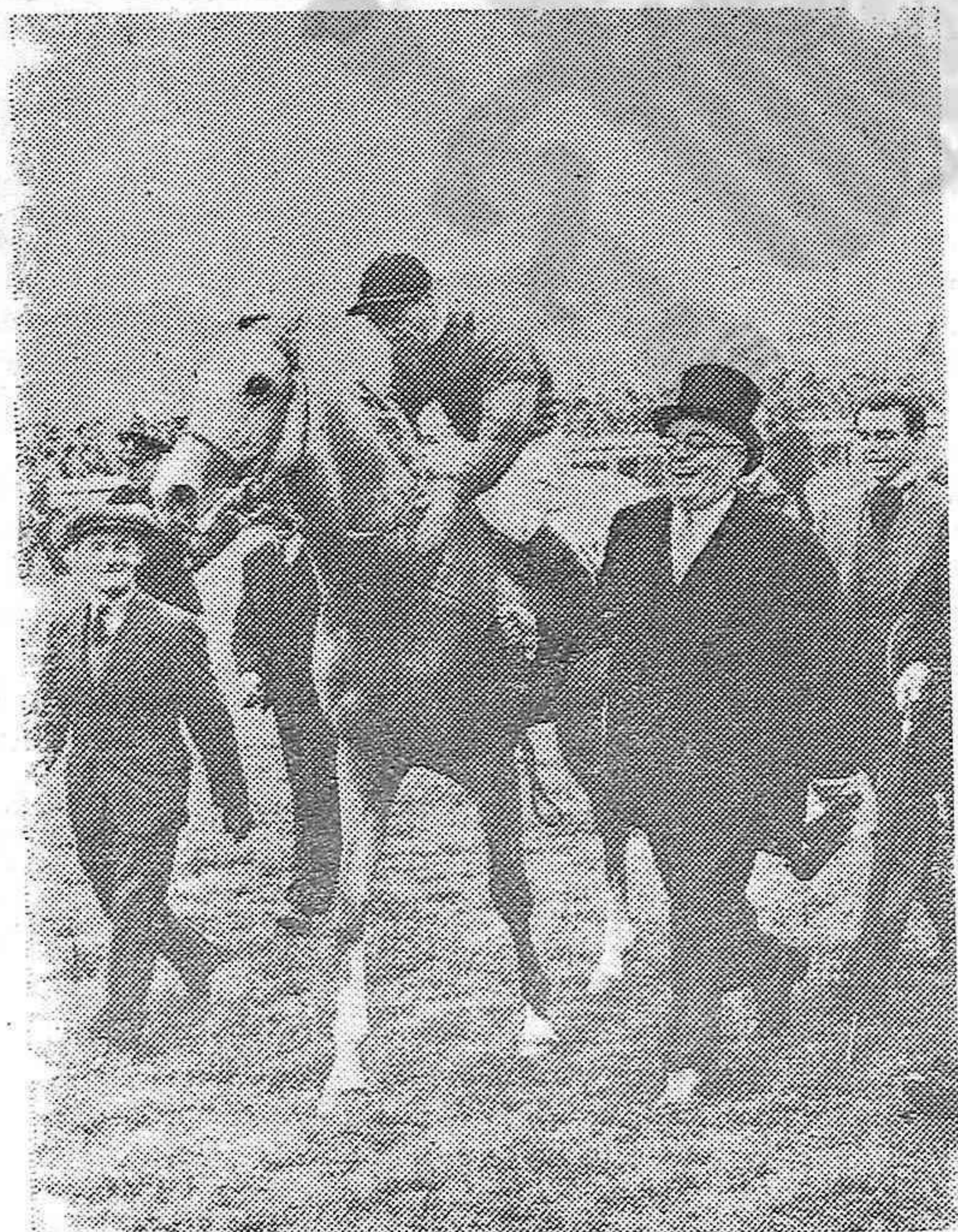
Este año la famosa carrera hípica "Derby" de Inglaterra, ha sido ganada por "Mahmoud", propiedad del conocido millonario turco Aga Khan.

Aga Khan, después de la victoria de su caballo, conduciendo a éste por las riendas lo muestra triunfante al público. Detrás de él va su hijo Aly Khan.