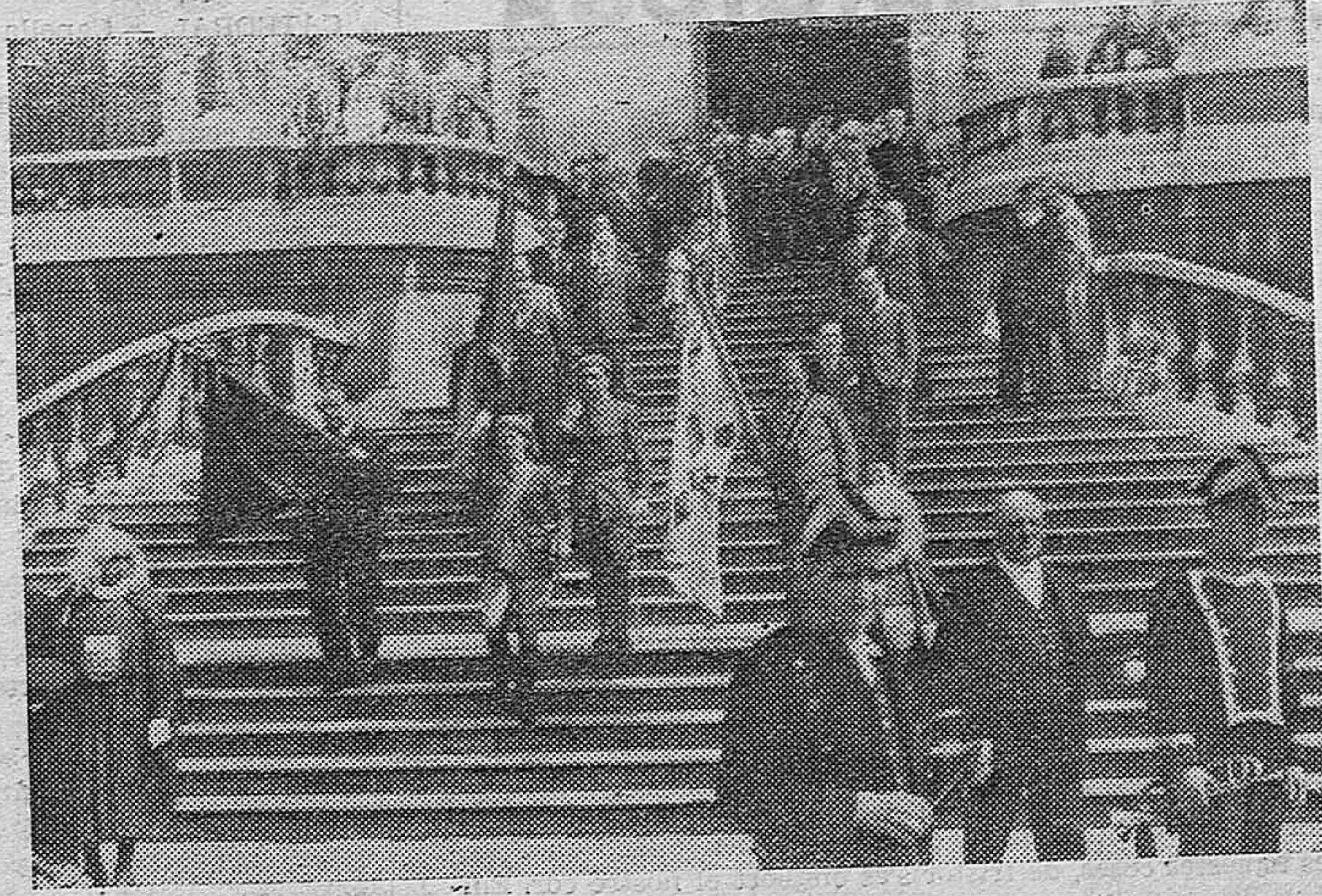
El día 2 de Mayo se celebró en Bilbao, una procesión cívica, con asistencia de numeroso público. Las banderas del sitio de Bilbao, figuran en lugar preferente.