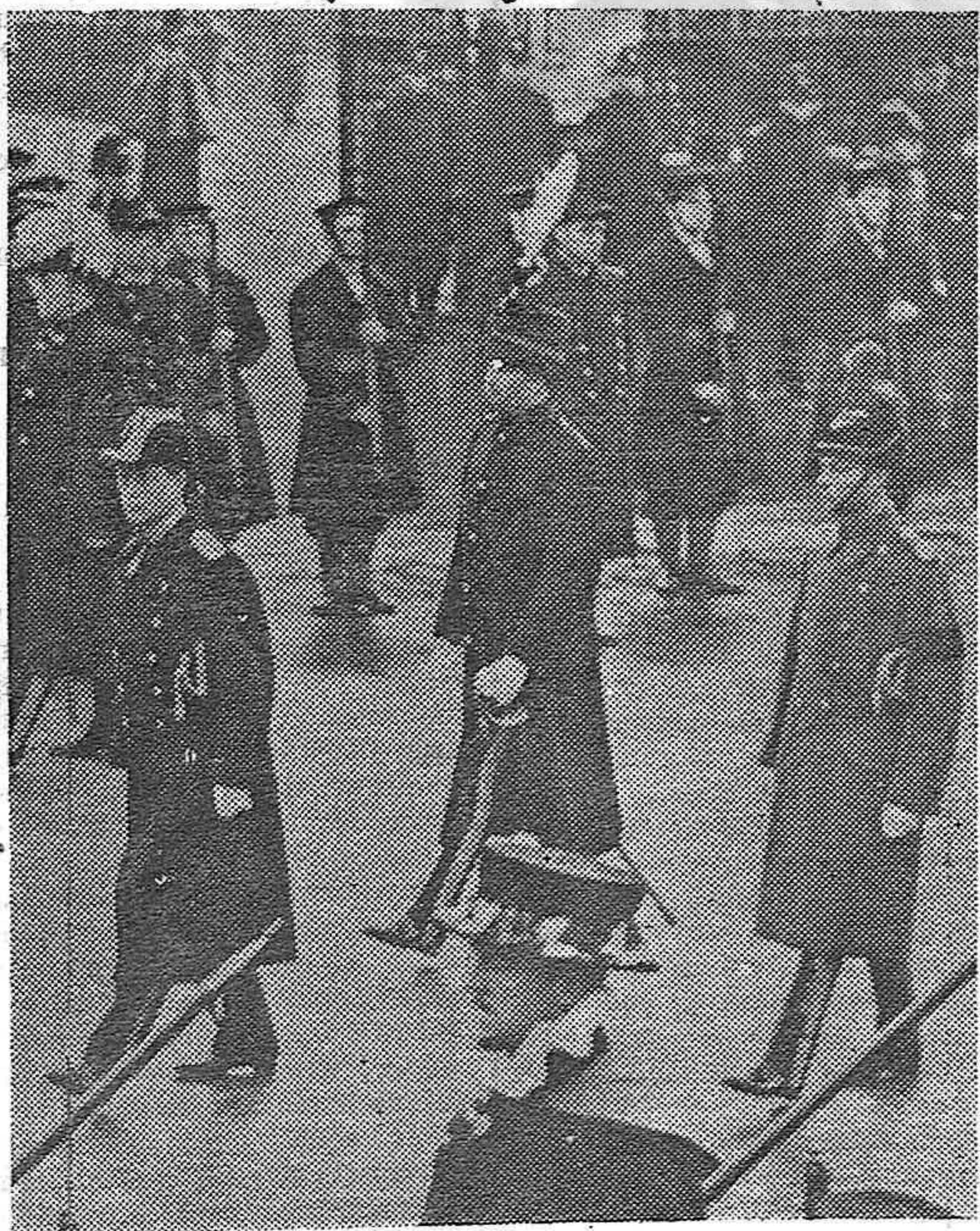
El Rey Eduardo VIII seguido de sus hermanos los duques de York, Gloucester, Kent y su cuñado siguió a pie el féretro conteniendo los restos de su padre. Este acto fué admirado con gran simpatía por el pueblo inglés.