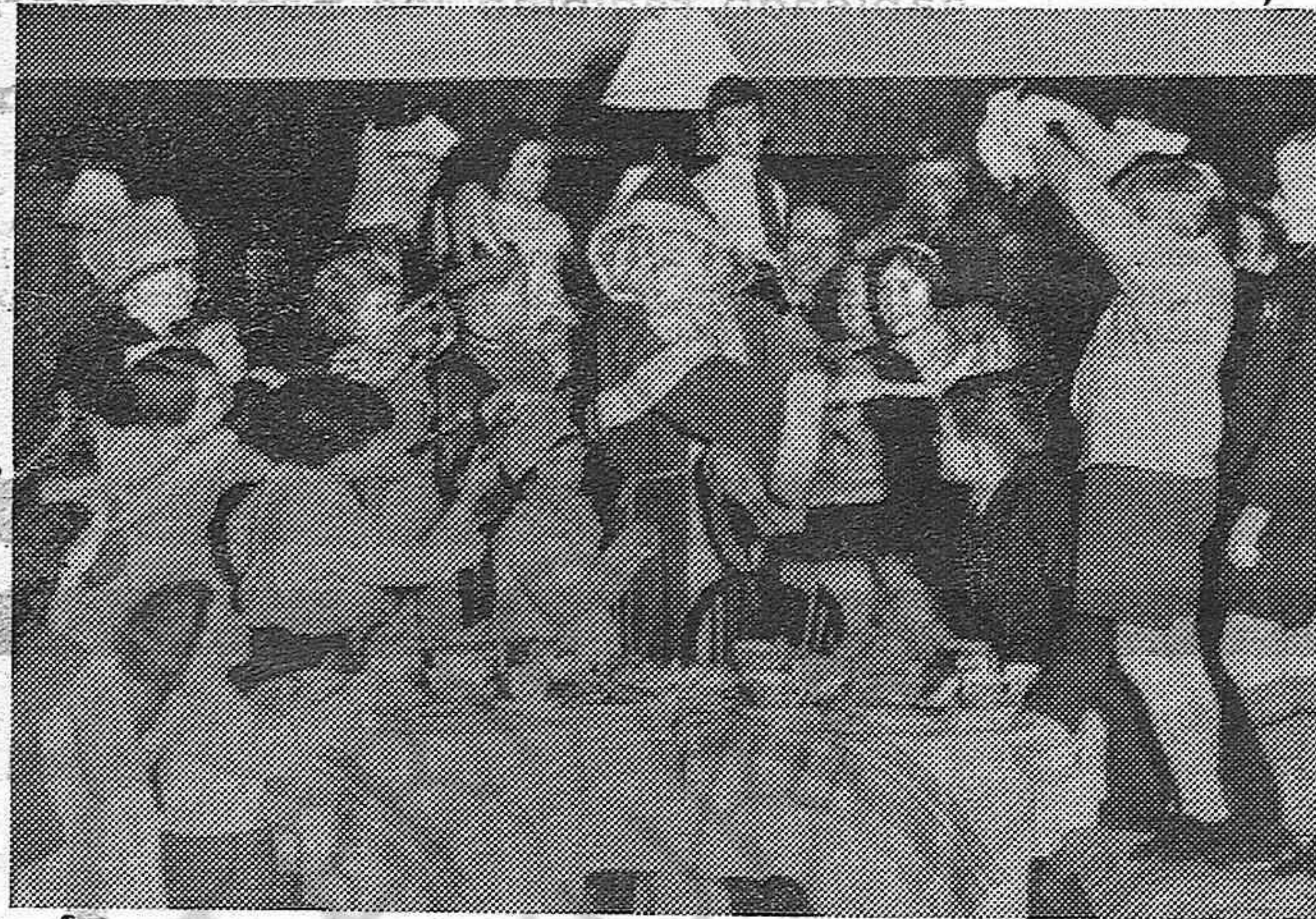
Con motivo de las fiestas de Navidad, la conocida actriz de la pantalla Lilian Harvey ha invitado a los niños de su distrito a una espléndida merienda ataviándose ella de Padre Noel. -- Lilian Harvey, junto con los niños, repartiéndoles chocolates y dulces, que hicieron la alegría de los pequeños.