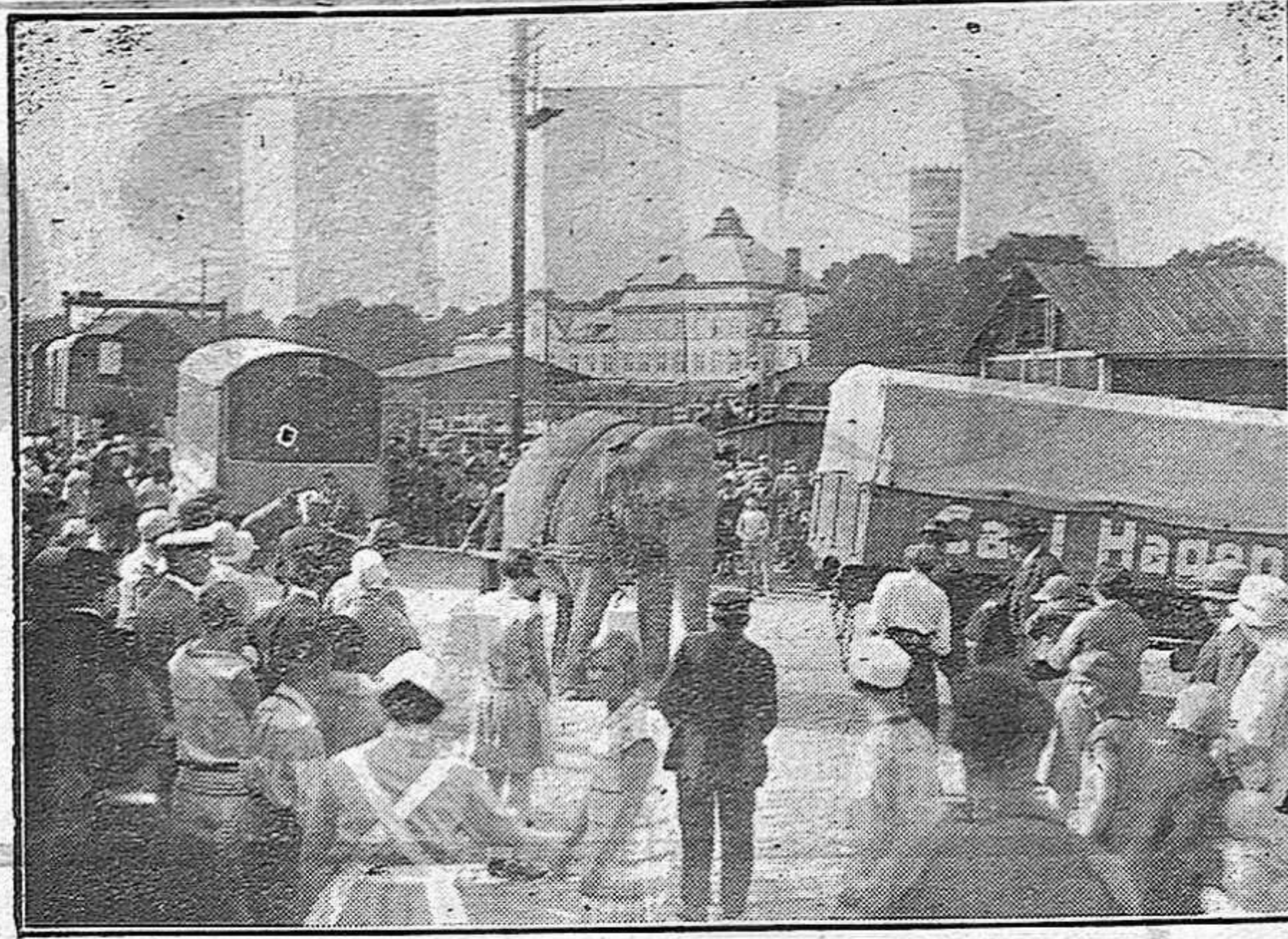
El Circo Carl Hagenbeck que debuta hoy en Tarragona