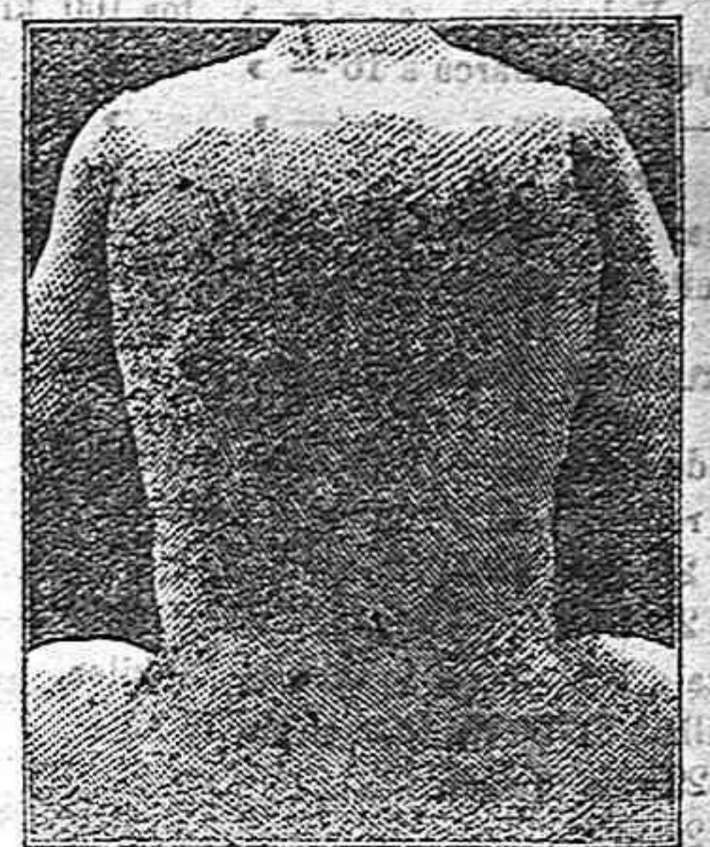
Después de 15 días del tratamiento