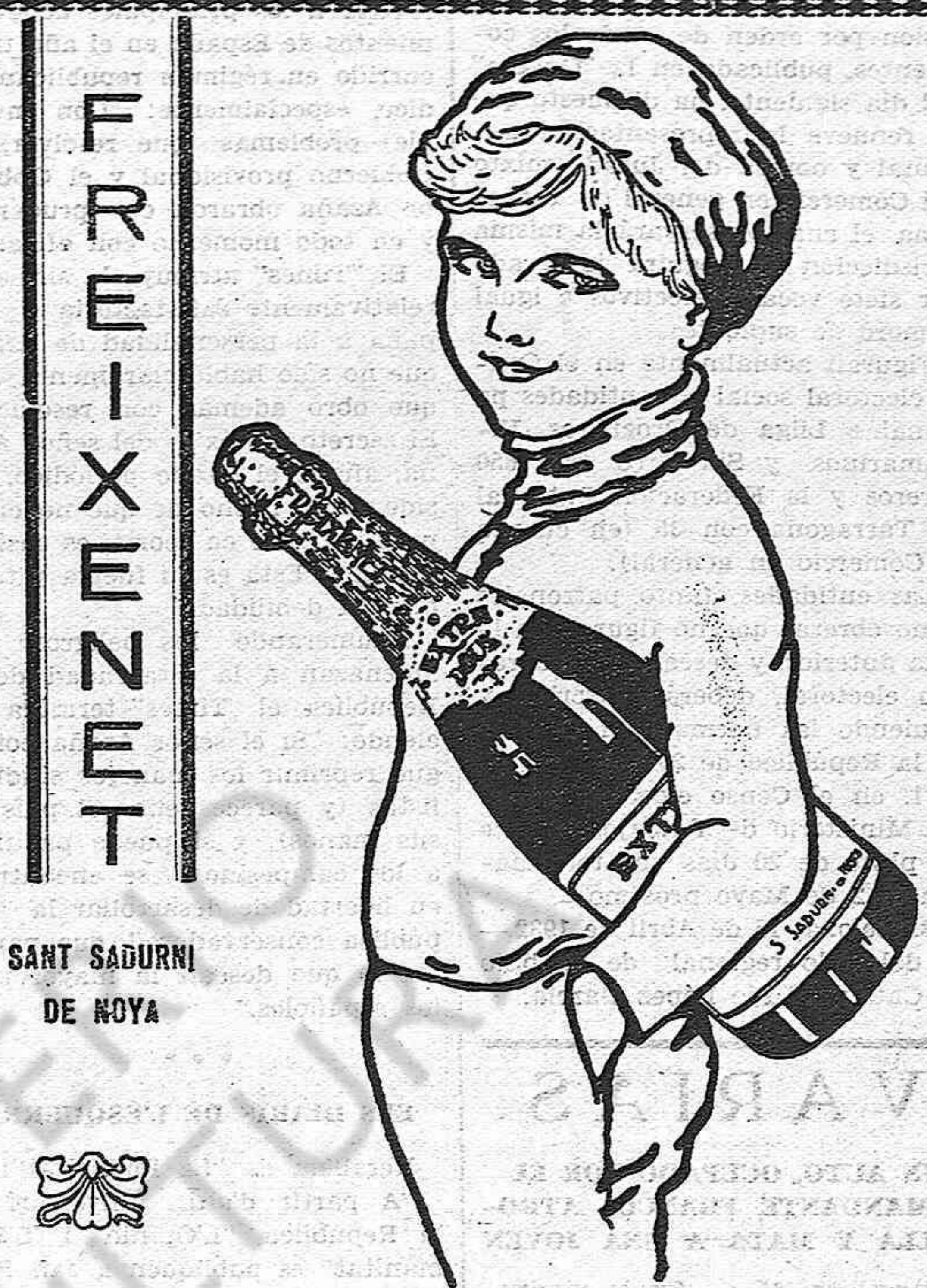
SANT SADURNI DE NOYA

(higado) Son las aguas minerales naturales más superiores y las de mejores resultados tomadas a domicilio. Insustituibles para la mesa.