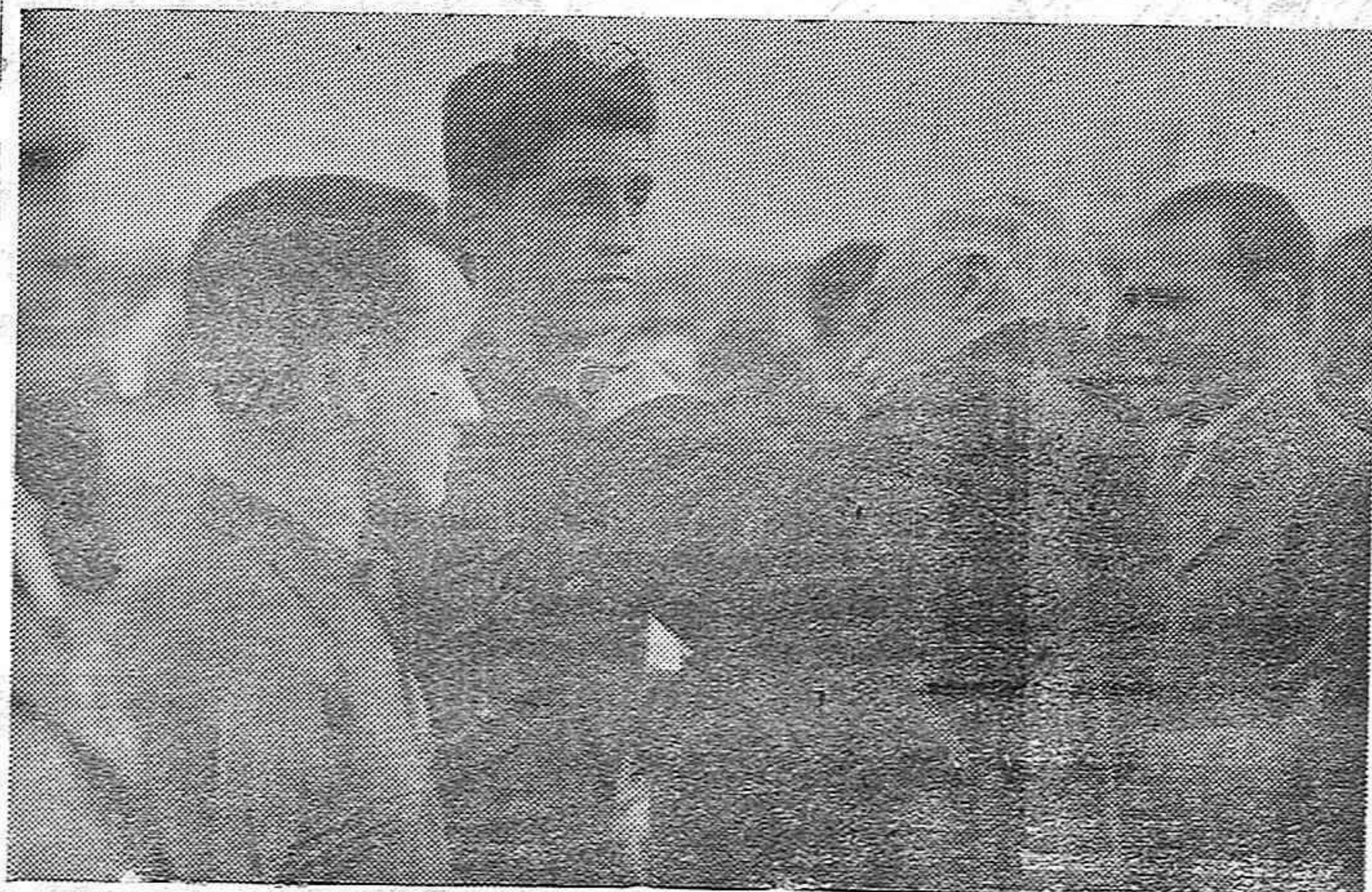
El presidente de la República, Sr. Alcalá Zamora, colocando las medallas de oro, a los jugadores españoles vencedores del encuentro.