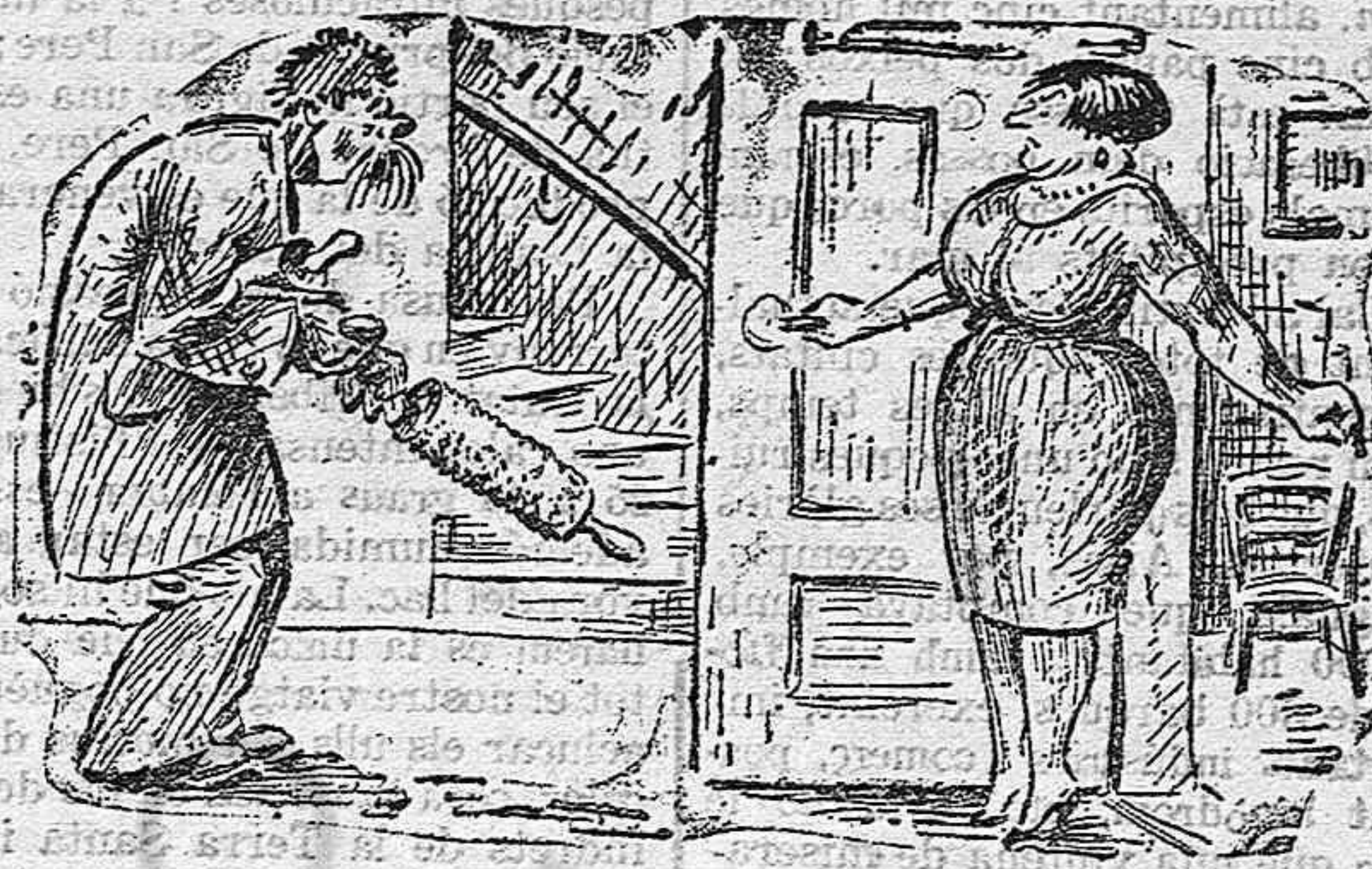
—On vas que treus de casa aquesta eina. —Vaig a donar una altra injecció d'acció republicana a aquests selectes del Teatre Principal.