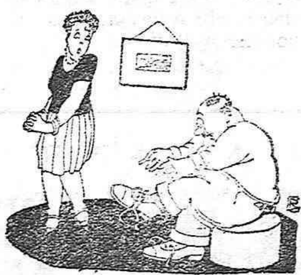
Ella. — ¡Ai senyor! I quan penso que quan ens vam casar éres campió de pes lleuger!