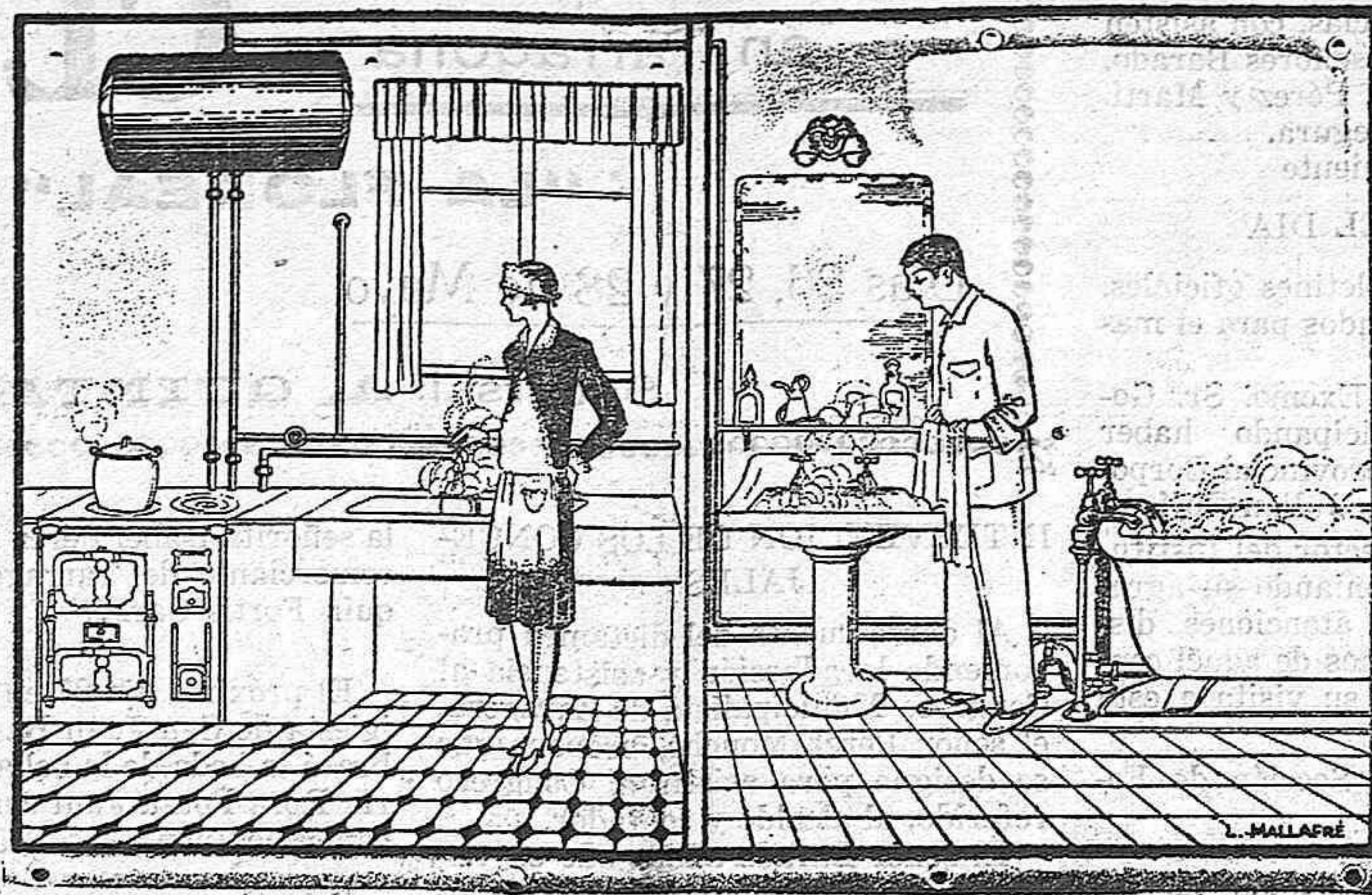
Se construyen para todas capacidades

Agua caliente para lavabos, baños, etc. sin ningún gasto. Puede instalarse en cualquier cocina, eleva con rapidez la temperatura del agua, conservándola así durante muchas horas.