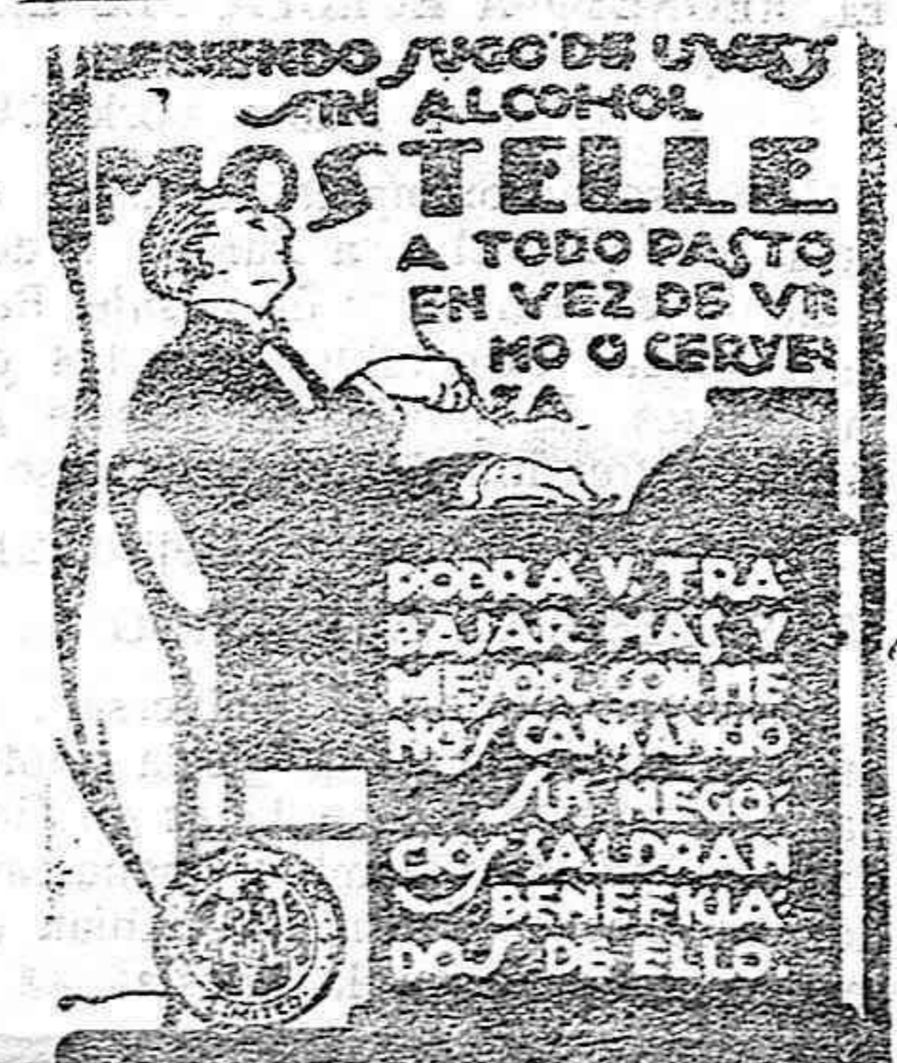
RAFAEL ESCOFET - TARRAGONA

Por su parte los armadores han equipado con obreros no sindicados otros tres buques.