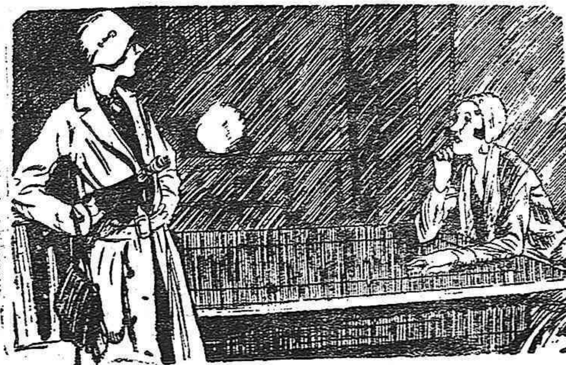
La sonàmbula. — Recorde que to davia no me ha pagado... La cliente. — Vd. debió adivinar que no tengo dinero.

EL TEXTO DEL PRESENTE NUMERO HA SIDO SOMETIDO A LA PREVIA CENSURA GUBERNATIVA :