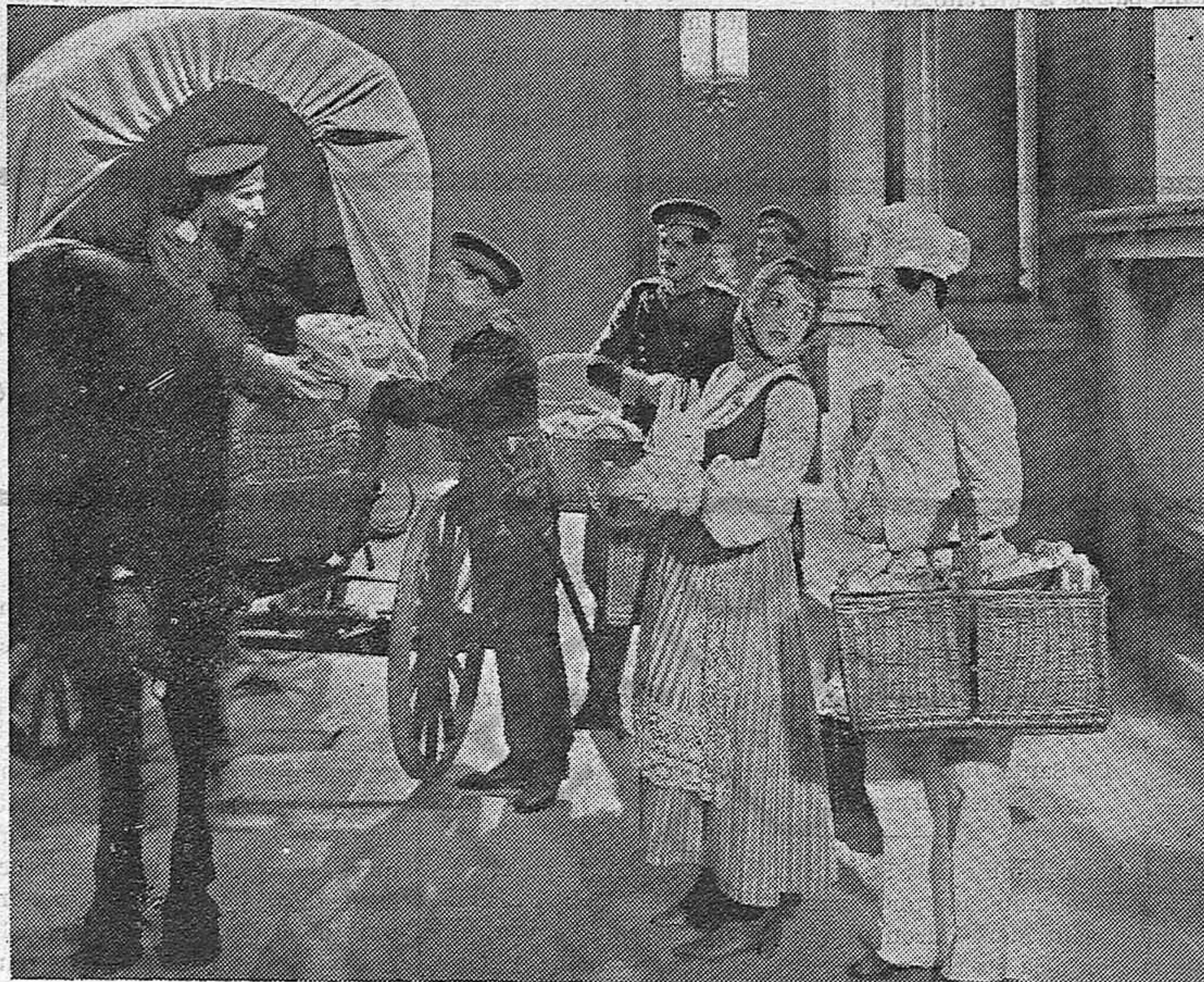
Una escena de la magnífica ópera alemana "Fiesta en Palacio" que distribuye la entidad vaticana Cifesa.