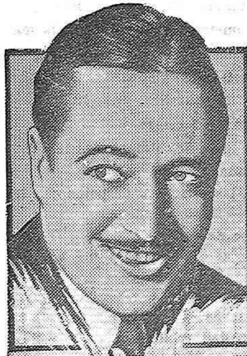
Edmund Lowe, protagonista de la comedia musical "Es hora de amarnos" que presenta Cifesa.

L'insigne inventor assegurarà que la televisió havia deixat d'ésser una quimera.