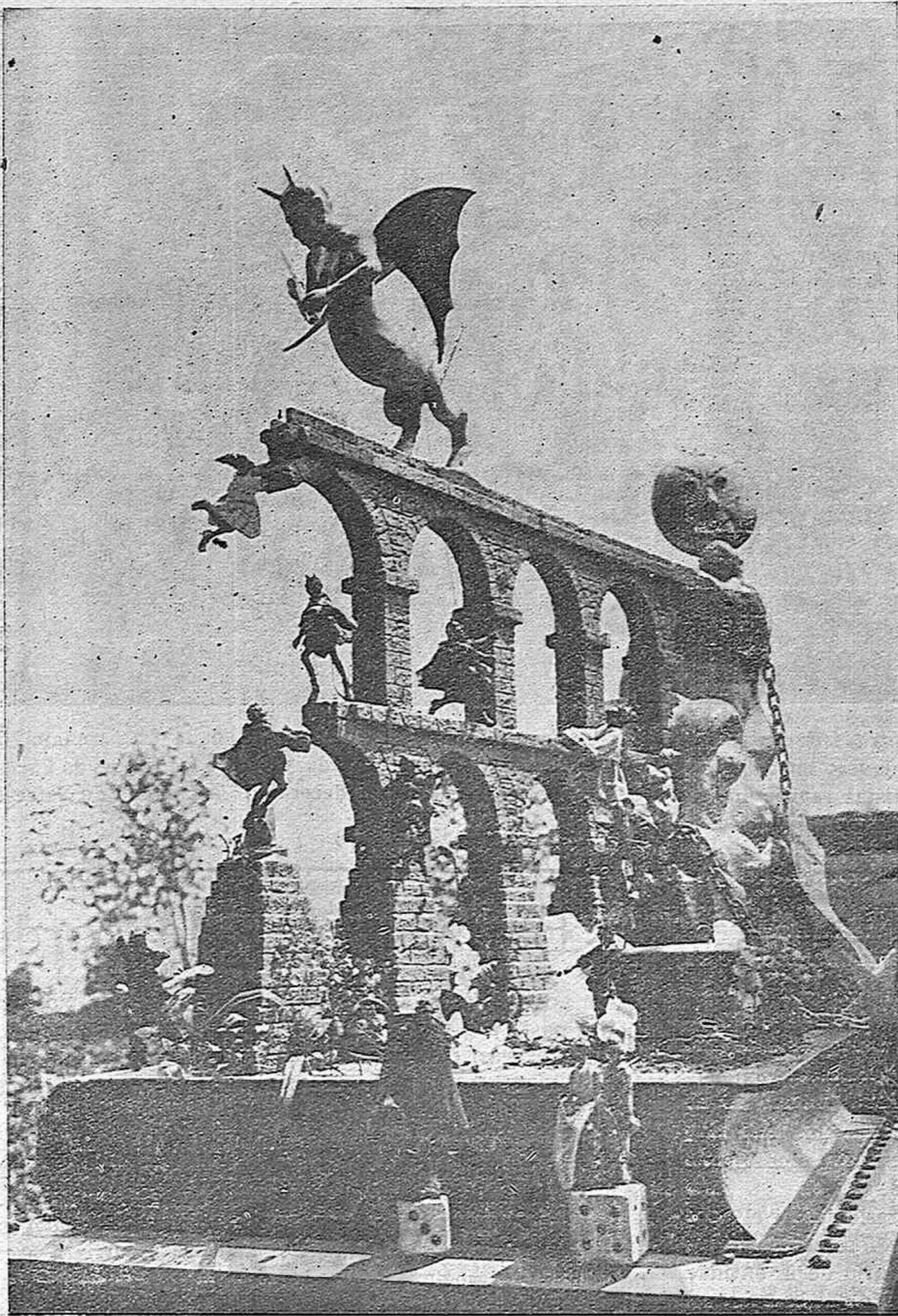
VISTA GENERAL DE LA FALLA DE LA RAMBLA DEL 14 D'ABRIL

EL GRAN SEGRET :: "NO SE PERMITE LA ENTRADA" :: EL GRAN BRUIXOT ÉS UN HOME PETITÓ :: DETALLS DE LA CONSTRUCCIÓ I MUNTATGE DE LES FALLES :: L'ÀNIMA DE LES FIGURES :: LES FALLES NO FALLARAN