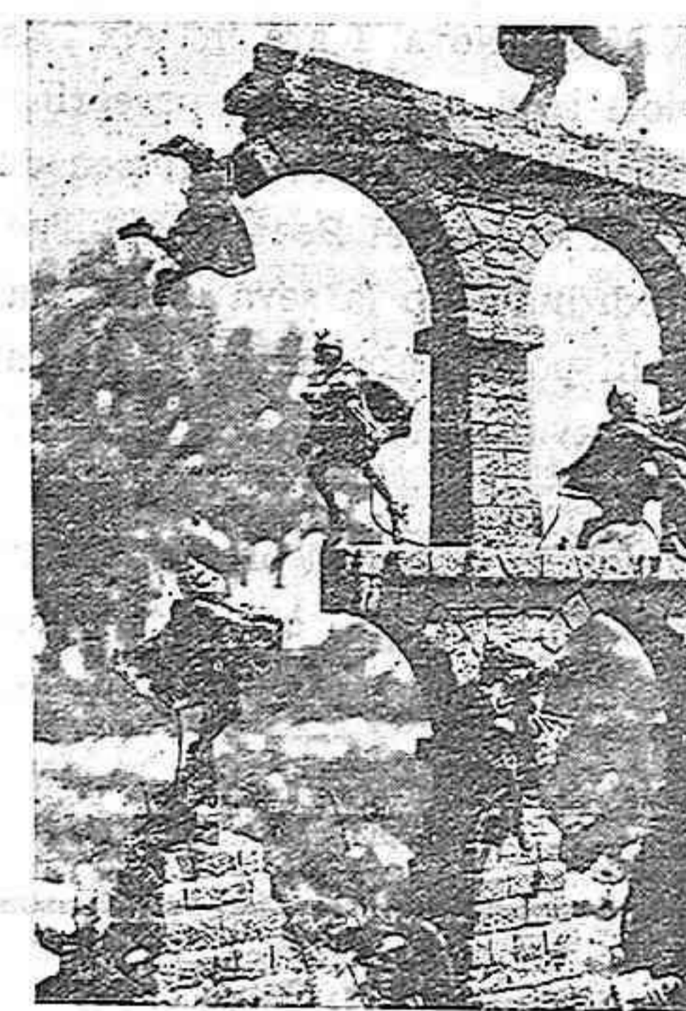
Els "dimeñis" en plena construcció.

senyà un armari ple de documents antics, de fórmules de màgia i signes cabalístics.