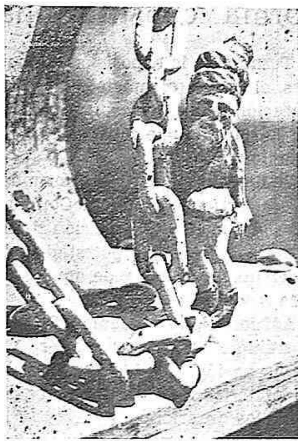
El follet "Puck"

Hem baixat davant una porta guardada per dos Cans Cervers amb uns ulls de pam i hem vist damunt els nostres caps un rètol ben